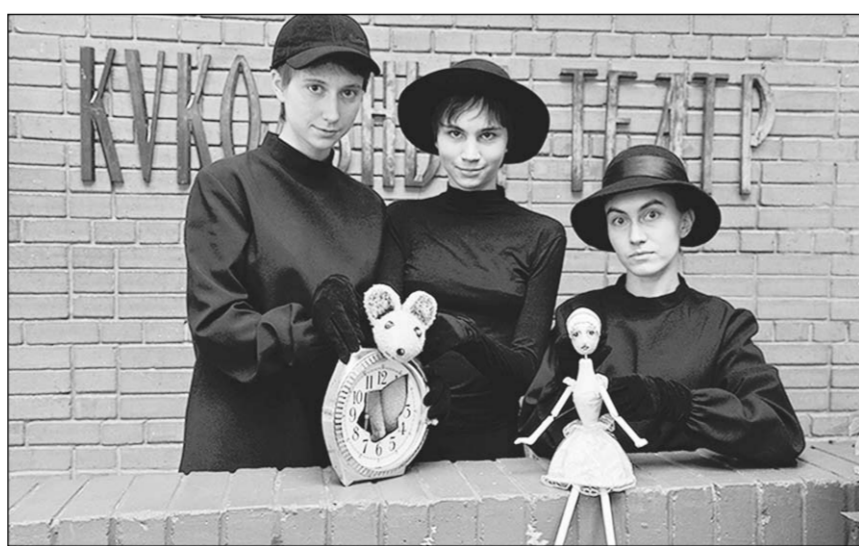
Участники театра-студии «Кукломания».