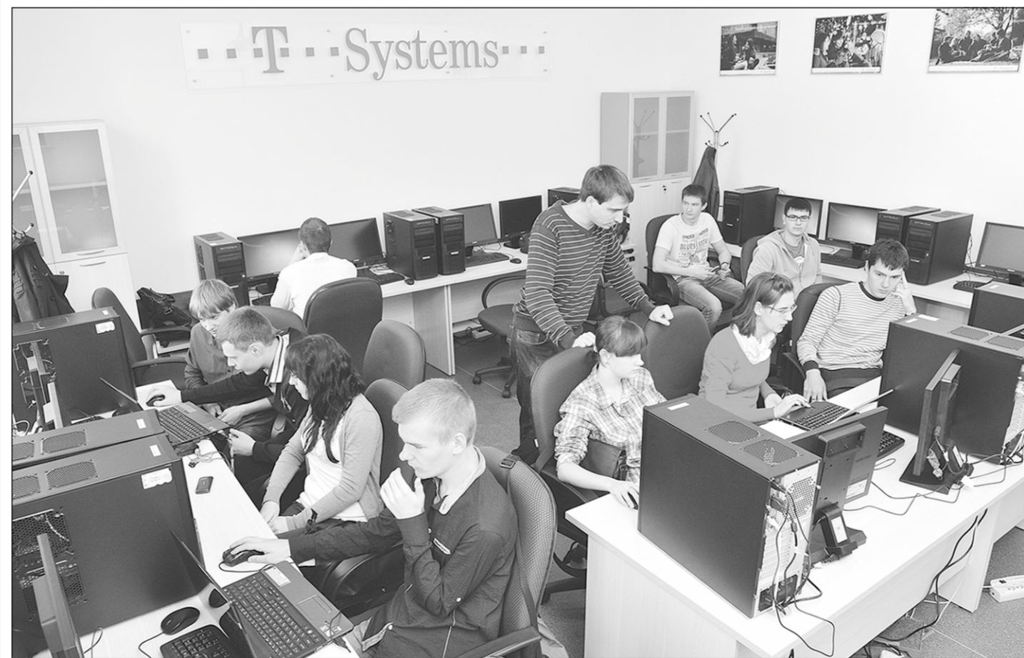
Учёба в Центре для молодых и амбициозных.

– До сих пор в Германии многие считают, что Россия – странная страна со странными людьми. Причем если на уровне менеджмента мнение меняется, то у простого народа до сих пор остаётся некая настороженность в отношении российских граждан. Сегодня в Германии учатся около 13 тысяч студентов из России. Это вторая по численности группа после китайцев. Отрадно осознавать, что за последние пять лет уровень стремления к интересной работе в молодых людях вырос в несколько раз. Своими национальными проектами и внедрением наших умных, толковых, немецкоговорящих ребят в эти проекты мы меняем отношение к нам в лучшую сторону. За последние два-три года филиалу T-Systems в России удалось добиться серьезных успехов, а по многим параметрам даже превзойти другие филиалы компании. Словом, мы делаем Россию и Германию ближе.