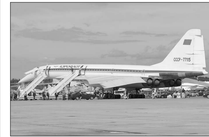
Ту-144 – визитная карточка всех авиасалонов МАКС.