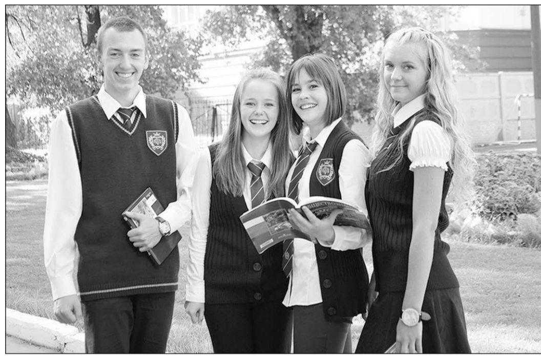
В гимназии имени Н.Г.Басова все – умники и умницы.

- Воспринимают их позитивно, но, главное, думаю, сохранено – программы по-прежнему будут формировать у детей стремление к творческому поиску. Мне будет очень жаль, если сократится число уроков по русскому языку. Достоинство должна быть представлена математика и другие предметы.