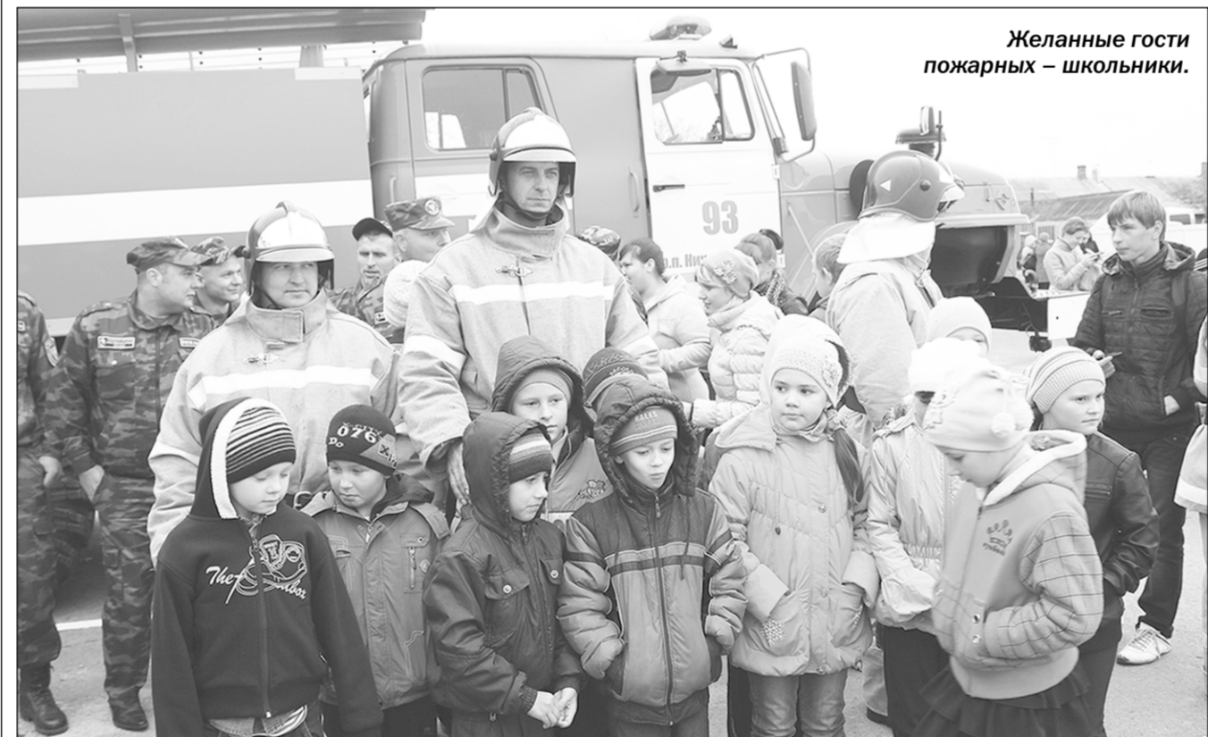
Желанные гости пожарных – школьники.

Кто бы мог предположить, что когда-нибудь заброшенные весовые помещения бывшего местного сахарного завода за короткие сроки превратятся в прекрасное пожарное строение - ПЧ №93 по охране посёлка городского типа Нижний Кисляй. И тем не менее это случилось. Создавали её всем миром.