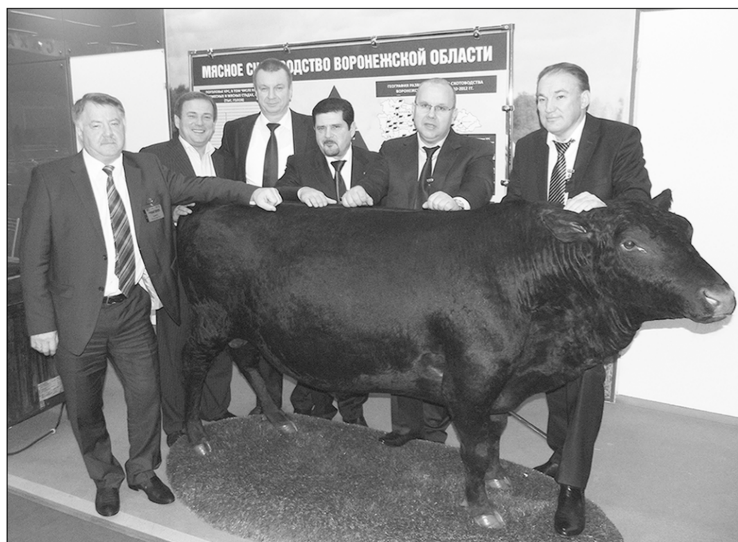
Мясное скотоводство – самая перспективная отрасль воронежского АПК.

Знай наших! | Воронежские аграрии привезли со Всероссийской выставки 11 медалей и «Гран-при»