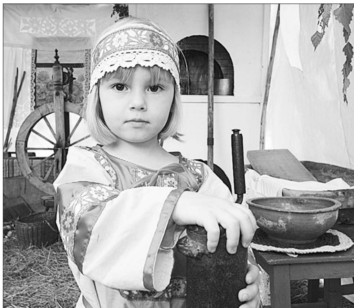
Фольклорными традициями сильна воронежская земля.

Чем же могут прославиться наши селения? Рамонь – не в счёт, там дворец принцессы Ольденбургской, получивший стараниями областных властей буквально вторую жизнь. А та же Новая Усмани? И здесь есть над чем подумать! Вспомним Всероссийский фестиваль орловского рысака, прошедший в конце августа минувшего года в селе Бабяково. Празднование 235-летия выведения знаменитой породы лошадей совместил с этапом чемпионата орловских рысаков в России. И в гостях у нас, как когда-то сказал поэт, были «все флаги». Гости из Италии, Мальты, Сербии, Словении, Украины, Франции – оказались в скромном селе Бабяково. Знатки рассказали приезжим об истории орловского рысака, которая