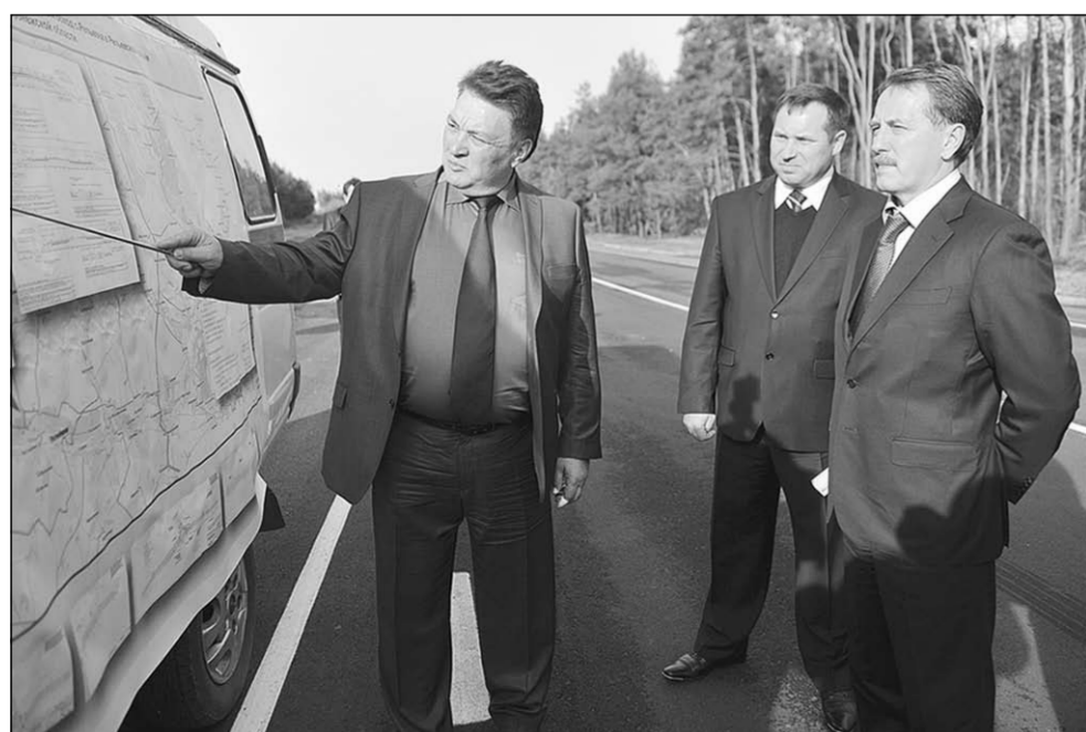
Хорошее качество и долговременность эксплуатации – главный критерий дорог.

Власть | Губернатор Алексей Гордеев совершил рабочую поездку в Репёвский муниципальный район, где оценил ремонт дорог, проведённый в райцентре