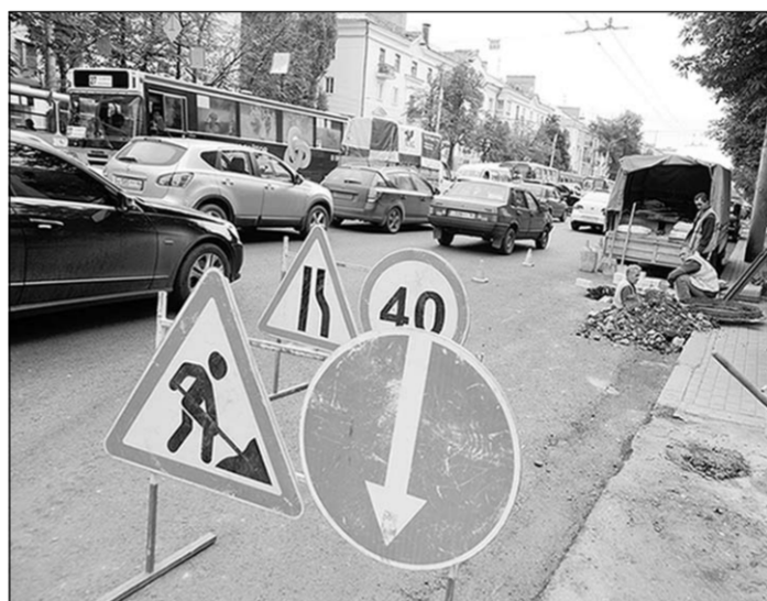
Ремонт дорог в Воронеже ведётся, но зачастую он серьёзно уплотняет «пробки».