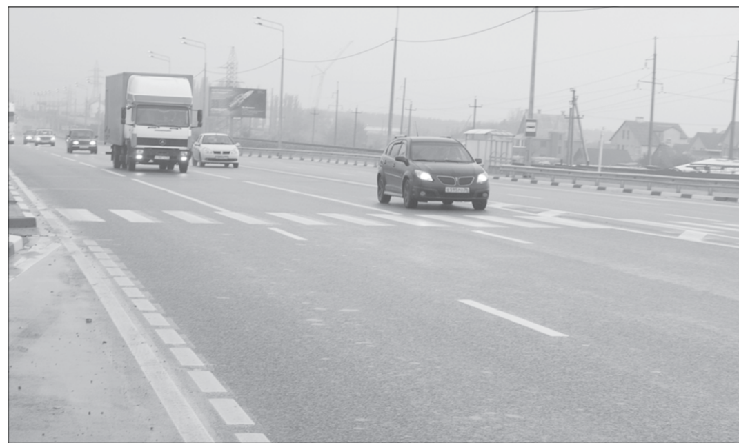
В добрый путь!

А также ремонт целого ряда городских магистралей.