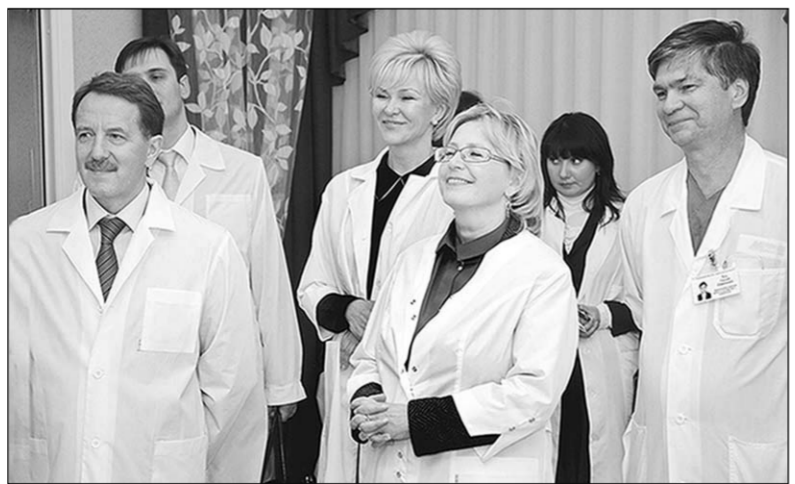
Участники совещания в перинатальном центре.

оказания медпомощи и возникающих проблемах, об улучшении доступности этой помощи для отдалённых сёл и необходимости решения кадровых проблем.