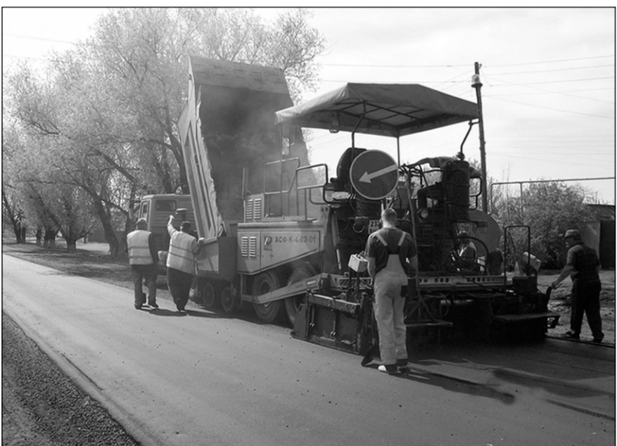
Техника к работе готова.

На каждом для автомобилистов должен гореть только зеленый свет. И если бы существовал сегодня российский аналог советского «знака качества», то им смело можно было бы маркировать дороги, построенные и отремонтированные коллективом Борисоглебского ДРСУ-2.