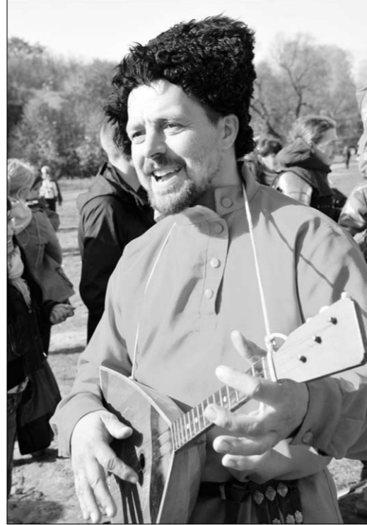
...и на балалайке сыграет.