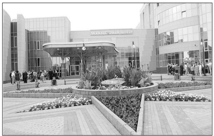
Молодёжный центр в Россоши.

В районном центре состоялся праздник в честь строителей, благодаря труду которых в Россоши появился уникальный Молодёжный центр.