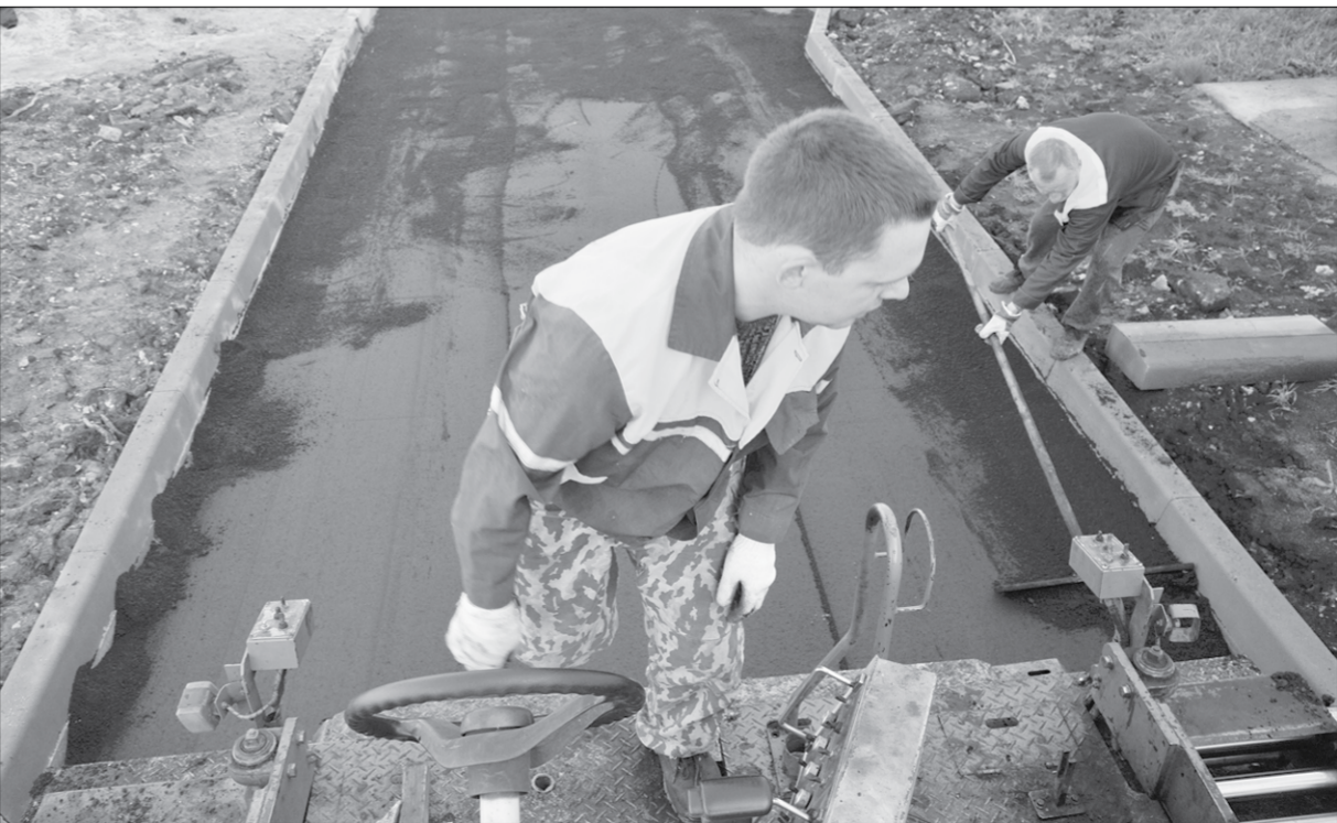
Укладка асфальта – дело тонкое.

«Рута» в переводе с испанского означает «дорога», а качество дорог, выполненных рамонской компанией, – ничуть не хуже испанского. Hasta la vista, рута.