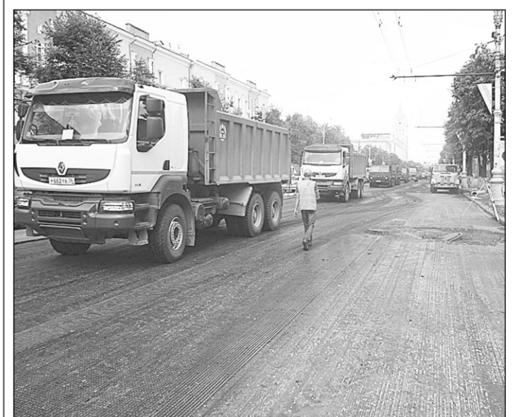
Самосвалы RENAULT ООО «СпецДорСервис» на ремонте проезжей части проспекта Революции.