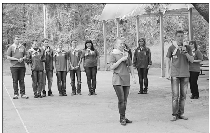
Мастер-класс по ораторскому искусству.

В детском оздоровительном лагере «Березка» состоялась школа молодёжного актива «Наш континент» для старшеклассников и студентов.