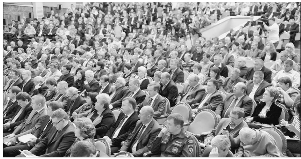
Только вместе можно вывести Воронежскую область в число лучших регионов России.

Столько же наших земляков против переименования улицы, названной в честь Сергея Орджоникидзе. Известный грузинский большевик и советский государственный и партийный деятель в годы Гражданской войны был одним из организаторов разгрома Деникина.