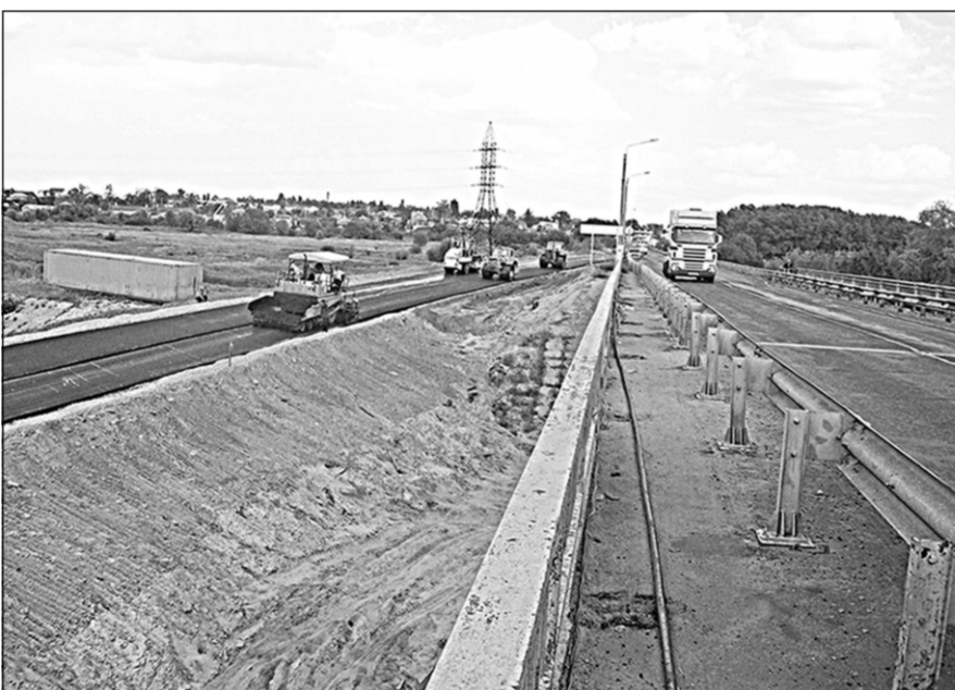
Скоро здесь появится новое полотно.

Тематический выпуск подготовили: Александр КАРЕЦКИЙ, Марина КАЛИНИНА, Сергей КРОЙЧИК, Юрий ЕРМАКОВ, Татьяна ЮШКИНА.