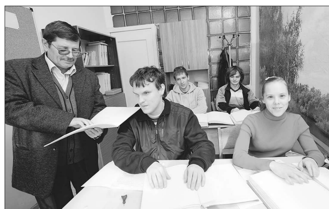
Педагогу приходится быть то священником-исповедником, то психологом.

— С одной стороны, прекрасно, когда ребенок с особенностями в развитии входит в коллектив, учится общаться, не изолирован от общества. Ведь в коррекционных школах с определенным направлением у детей общие проблемы, они живут в своем маленьком мире. А в обычном учебном заведении — целое поле жизни. Но с другой стороны, наше государство пока не готово к инклюзии: и менталитет людей