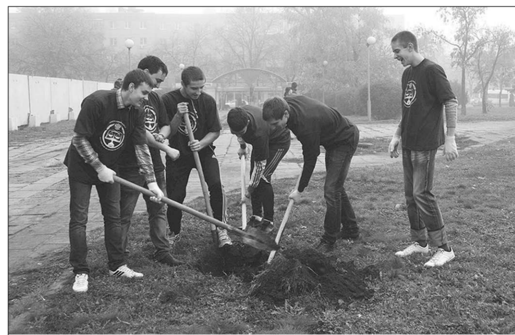
Студенты работали дружно и весело.

Референт губернатора Воронежской области по охране