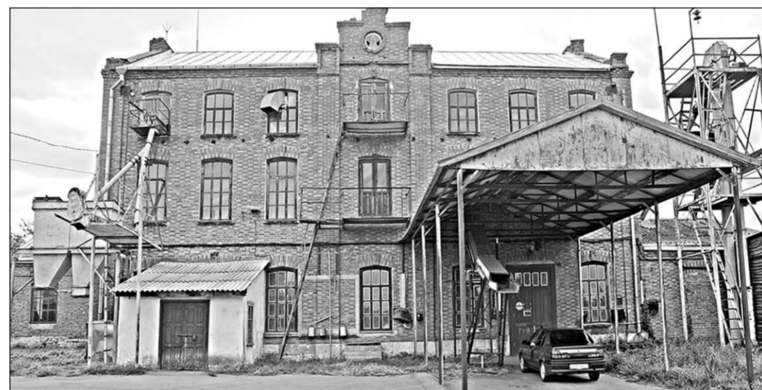
Мельница столетнего возраста.

У тысяч небольших, провинциальных городков России нынче одни и те же проблемы. Скудные бюджеты, крайний дефицит рабочих мест, безработица, отъезд на заработки сотен работоспособных людей, отсутствие развитой промышленно-строительной структуры и развитого частного бизнеса ставят трудности в создании внебюджетных накоплений. Добавим сюда всевозможные коммунальные и социальные неурядицы, вызывающие недовольство населения. Как в таких условиях живётся тем, кто остался предан своей малой родине, не теряют ли они жизненный оптимизм? Об этом цикл публикаций под общей рубрикой «Письма из Богучара».