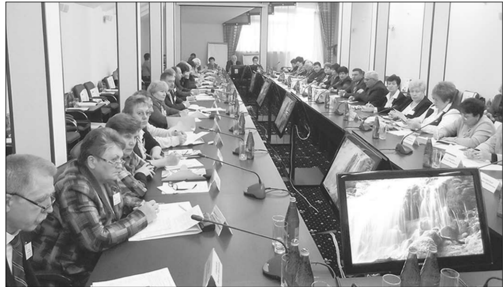
Во время семинара.

В санатории-профилактории «Энергетик» Нововоронежской АЭС состоялся обучающий семинар с руководителями общественных приёмных губернатора Воронежской области.