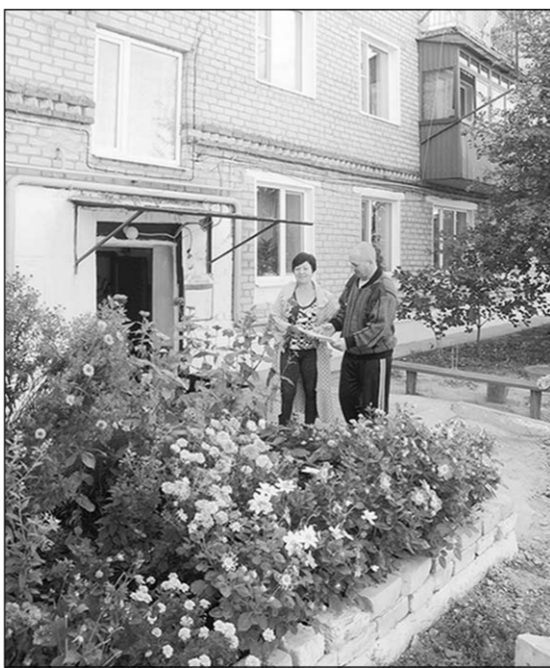
Дом №78 по улице Дзержинского.

Понемногу хорошеет город, одевается в цветники, улицы опоясываются тротуарами из цветной плитки, городской парк становится любимым местом отдыха горожан, а на следующий год планируют открыть кафе на берегу Богучарки и перебраться через неё пешеходный мостик. Воз-