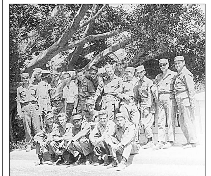
Остров Куба. Защитники революции.