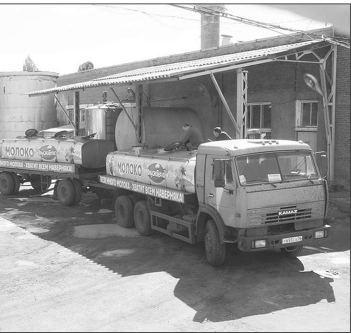
С ферм района прибыл груз в ОАО «Богучармолоко».

Сыр, который здесь выпускают, известен далеко за пределами Воронежской области. Да и многие покупатели предпочитают Калачевский и Российский сыры именно богучарского производства. Качество их всегда на высоте, хотя за 38 лет своего существования предприятие стало выпускать его вдвое больше. Кроме того, производится масло, сырки