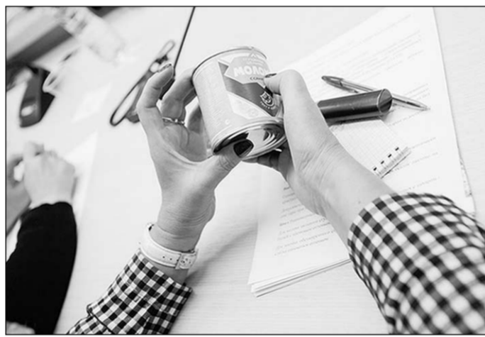
Фальсификат распознать непросто.

Оценку молочных консервов на этот раз проводили по органолептическим показателям эксперты и более ста потребителей. Перед ними были выставлены пронумерованные стаканчики со «сгущёнкой», так что заводы-изготовители были неизвестны. Их «раскритиковали», когда подольщили итоги. Итак, наименьшее количество баллов, то есть «двойку» поставили «сгущёнке» ЗАО «Дмитровский молочный комбинат» из Московской области.