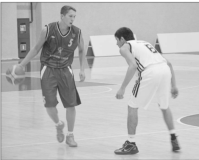
В атаке «Согдиана».