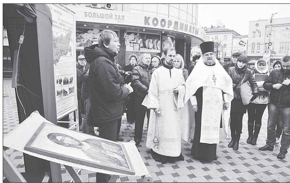
Память не знает сослагательного наклонения.

В траурной церемонии перезахоронения на территории мемориального комплекса в посёлке Дубовка приняли участие представители администрации Воронежа и области, Воронежской и Борисоглебской епархий, общественных организаций, родственники репрессированных и ученики городских школ. После отпевания и погребения останков участники церемонии возложили к могилам венки.