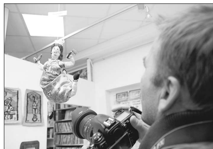
На выставке отца и дочери.

Для Евгении это был премьерный вечер — начало пути