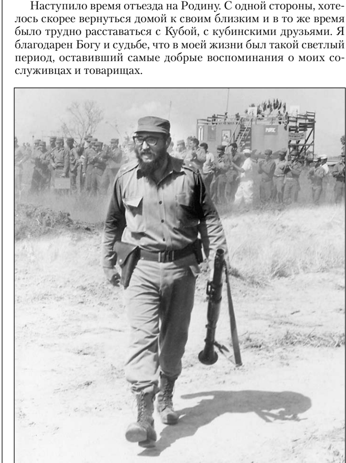
Легендарный Фидель Кастро.

Эти события происходили более сорока лет назад, но они сохранились в памяти. Да и можно ли забыть, когда у тебя на глазах такая легендарная личность, как Фидель Кастро, бродит по полигону с гранатометом в окружении советских и кубинских молодых парней. Наступило время отъезда на Родину. С одной стороны, хотелось скорее вернуться домой к своим близким и в то же время было трудно расставаться с Кубой, с кубинскими друзьями. Я благодарен Богу и судьбе, что в моей жизни был такой светлый период, оставивший самые добрые воспоминания о моих сослуживцах и товарищах.