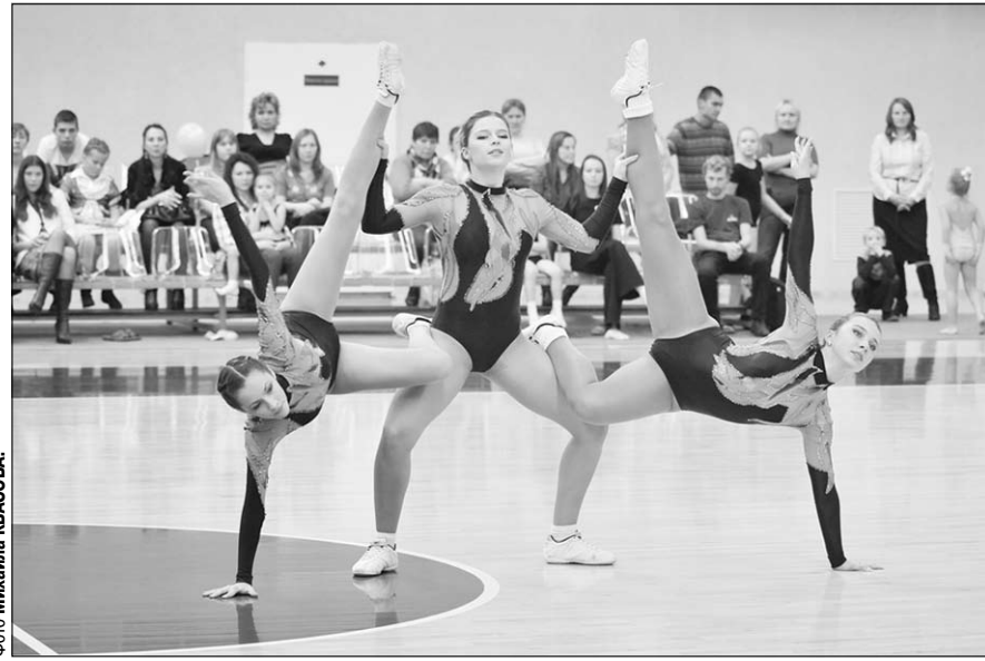
Гимнастика - это красота и здоровье.

«Для меня большая честь присутствовать на этом фести-