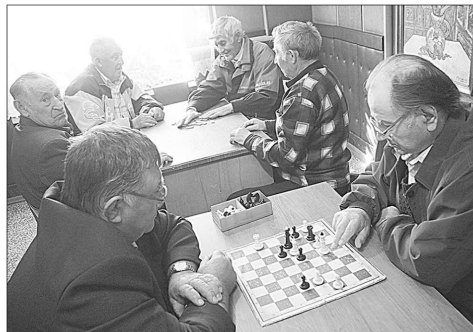
Шах и мат... унынию и возрасту.

Задать интересующие вопросы о поверке приборов учёта холодной воды можно специалистам соответствующего отдела дирекции по сбыту ООО «РВК-Воронеж» по телефону: 260-54-23, 260-54-44.