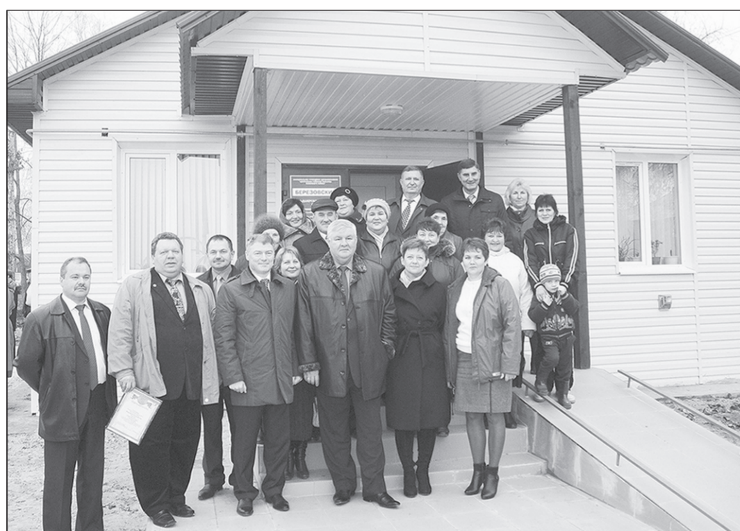
Радость с жителями разделили те, кто был причастен к строительству.

Как живёшь, село? | Для жителей Берёзово Рамонского района построили новый фельдшерско-акушерский пункт