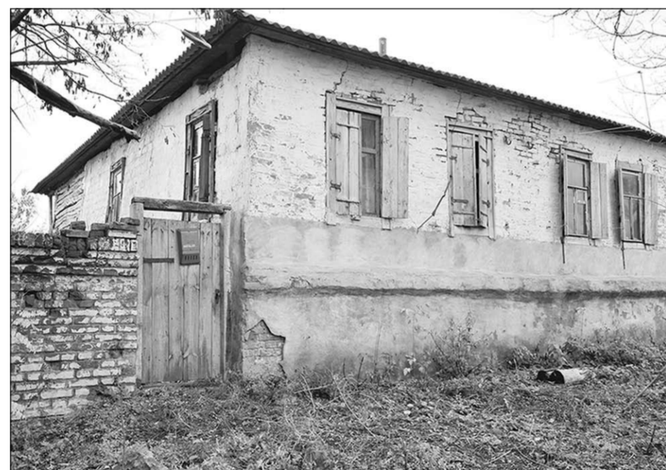
Дом в пригороде Острогожска, в котором Маршаки поселились в 1869 году. В музее.

В годы Советской власти в этих стенах работал летний кинотеатр, а последние лет двадцать здание никак не используется. В начале 2000-х возникла идея передать его местной школе искусств, но по