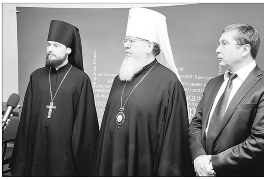
Соглашение подписано. Впереди большая и интересная работа.