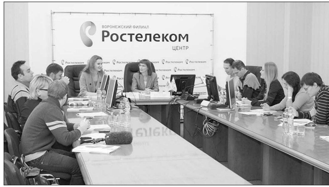
На пресс-конференции с воронежскими журналистами.

Кампания по запуску нового бренда многогранна и завершается в этом году. Важно было настроить потребительскую аудиторию на лёгкое восприятие этого логотипа, познать его с новыми визуальными образами. И когда имиджевая кампания завершилась, «Ростелеком» принял стратегическое решение сконцентрироваться на предлагаемых продуктах с рекламой этого же «уха». Это услуги широкополосного доступа к сети Интернет, интерактивного телевидения, интеллектуальных инфокоммуникационных сервисов. Помог рассказать о новых продуктах и рекламный ролик из жизни семьи