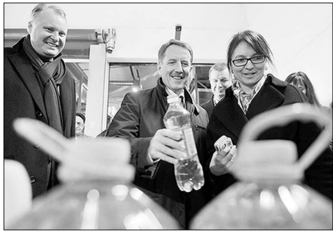
Доля рынка компании ЗАО «Ойл Продакшн» в сегменте продаж подсолнечного масла по стране доходит до 5 процентов.