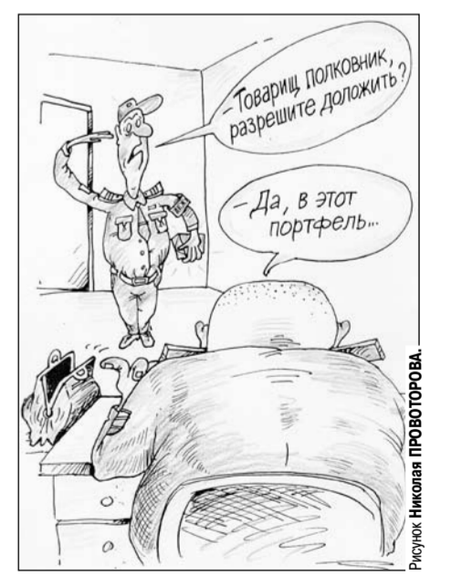
Рисунок Николая ПРОВОТОВА