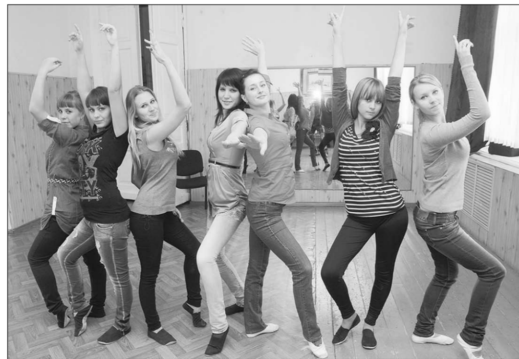
Репетирует ансамбль «Каскад». На концертах его встречают с восторгом.