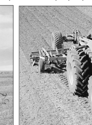
Тракторы Agrotrop работают уже и на воронежских полях.

моульным поперечным сечением. Идущий следом улавливающий каток завершает формирование борозды внизу и сбоку, так что зерна даже при неблагоприятных почвенных условиях не перекатываются по борозде, а улавливаются и вдавливаются в расположенным за ползом сошником катком. Это гарантирует оптимальное качество укладки. Поскольку улавливающий каток расположен позади бороздоуплотнителя, то качество укладки остается постоянным даже при высокой скорости движения. Преимуществом в сравнении с традиционными селлками точного высева является также и то, что точность укладки с системой Xpress не зависит от изношенности высевающих сошников.