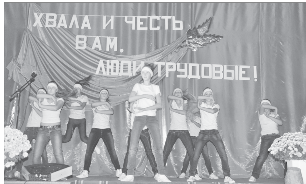
Песни и танцы юных артистов стали настоящим подарком для селян.

Но есть и общие задачи. Это повышение урожайности наших полей за счёт новых технологий, рост продуктивности животных, снижение себестоимости на единицу продукции. Верю: именно так, действуя по самым современным меркам, мы не просто выдержим обостряющуюся конкуренцию, но и будем устойчиво развиваться дальше.