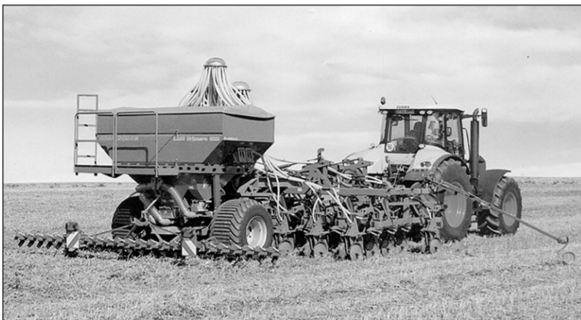
Селлка PRIMERA DMC можно сеять сразу после уборки урожая.

нередко туда попадает и неразделанная солома – тоже не лучшее соседство для семян. Результаты с дисковыми сошниками для масштабов AMAZONE были неудовлетворительными, и ставка была сделана на максимальное совершенствование долотовидного сошника. Аграрии десятков стран Европы и Америки быстро ощутили их преимущества. Иного, впрочем, и быть не могло. Ведомые на параллелограмме сошники селлки Amazone Primera DMC с агрессивно установленными бронирован-