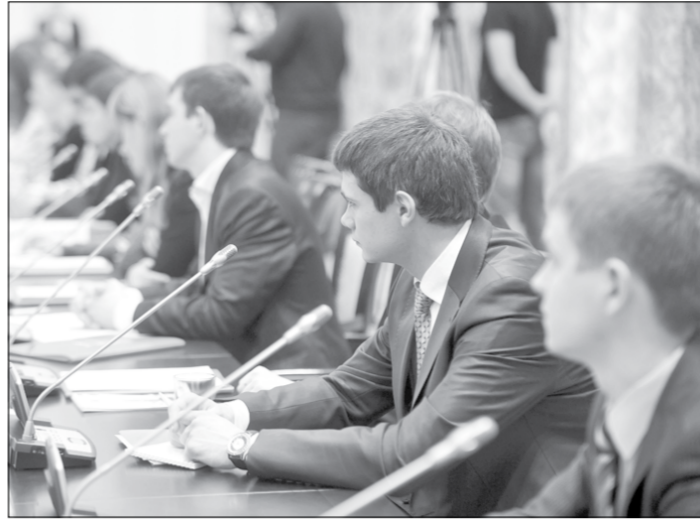
Молодые делегаты активно участвовали в работе форума.

После представления молодежных правительств задали ряд интересующих вопросов. В частности, ребята из Воронежа попросили полпреда и губернатора высказать мнение о прошедшем не так давно в областном центре мониторинге эффективности высших учебных заведений, про-