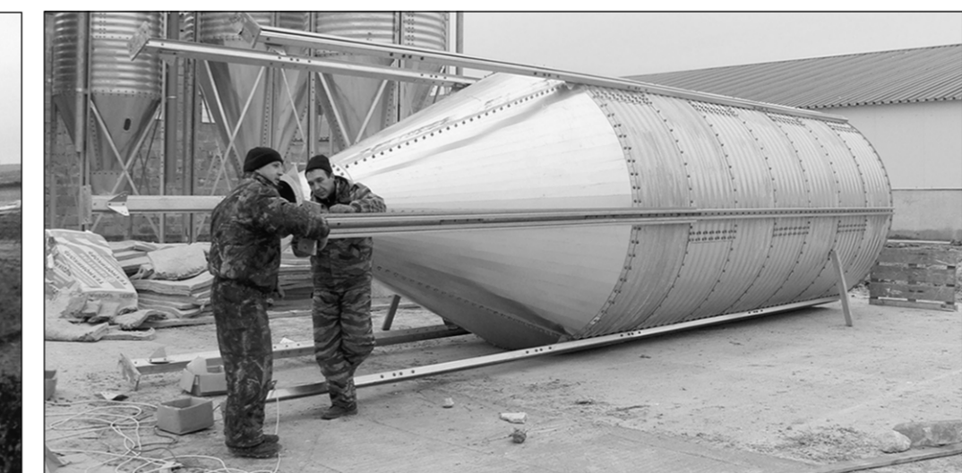
Монтаж оборудования для кормокухни.