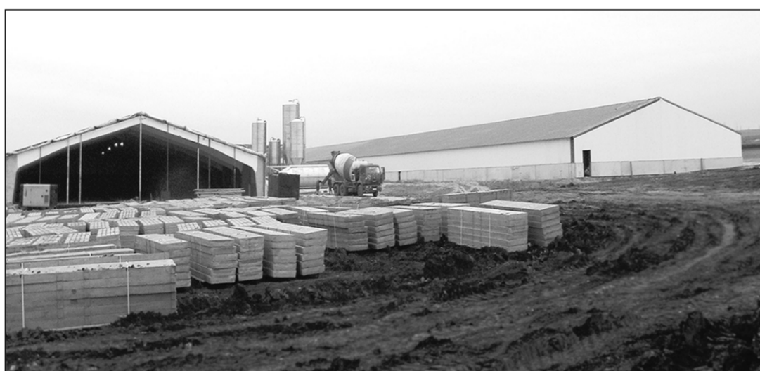
Новые корпуса свиноводческого комплекса под Нижним Ольшаном.