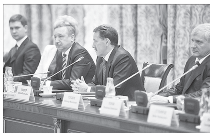
Алексей Гордеев и Александр Беглов приветствовали представителей Молодёжных правительств.

и выйти на эффективную политику, и прежде всего – молодёжную. Есть сферы, которые вы чувствуете лучше нас. И поверьте – когда мы принимаем тот или иной документ, мы хотим, чтобы молодёжи жилось от этого лучше, – отметил губернатор.