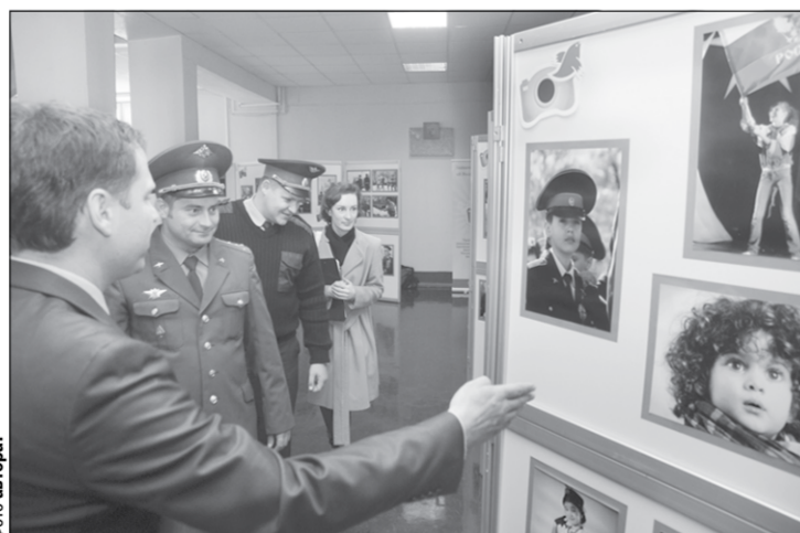
В проекте участвуют сотни фотографов.