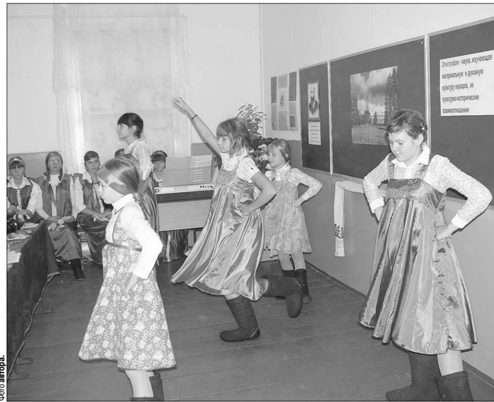
Надев красивые, расшитые узорами сарафаны, с лентами в волосах, платками на плечах, девушки словно примерили каждая на себе образ русской женщины.

Пока жюри подводило итоги, юные краеведы отправились в школьный музей — гордость новомакаровцев. А затем состоялось награждение. Отмечено было участие каждого, в том числе новгородцев: ведь они признаны лучшими и будут принимать в стенах своей школы участников следующей конференции.