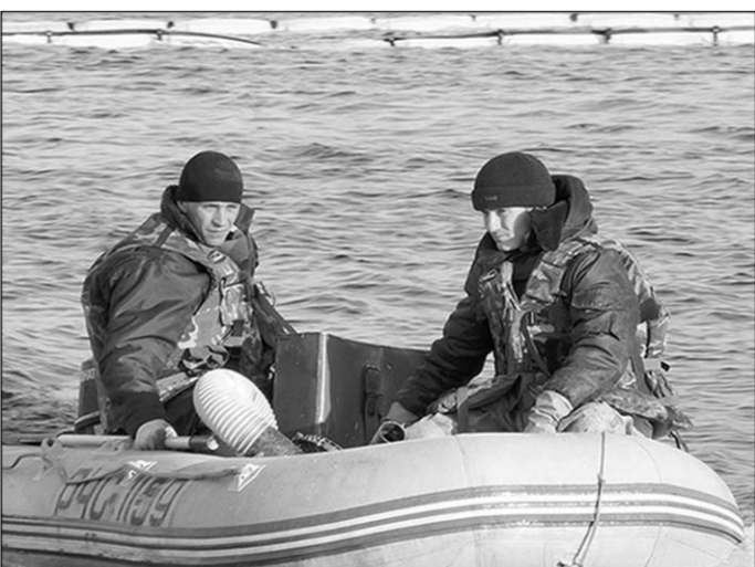
Работает бригада областной службы спасения.