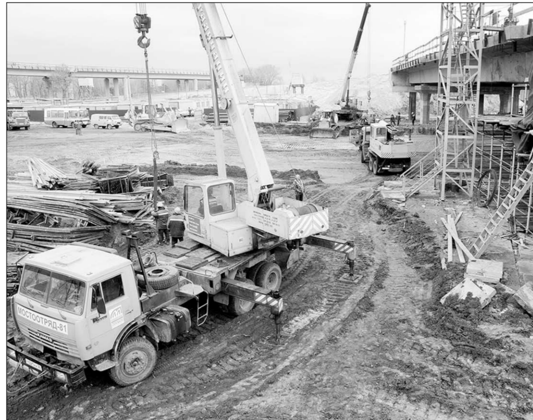
Полным ходом идут строительные работы на трёхуровневой транспортной развязке автодороги М-4 «Дон».

Актуальная тема | На встрече губернатора Алексея Гордеева с советником Президента РФ Игорем Левитиным шла речь о модернизации автомобильных дорог и Воронежского аэропорта