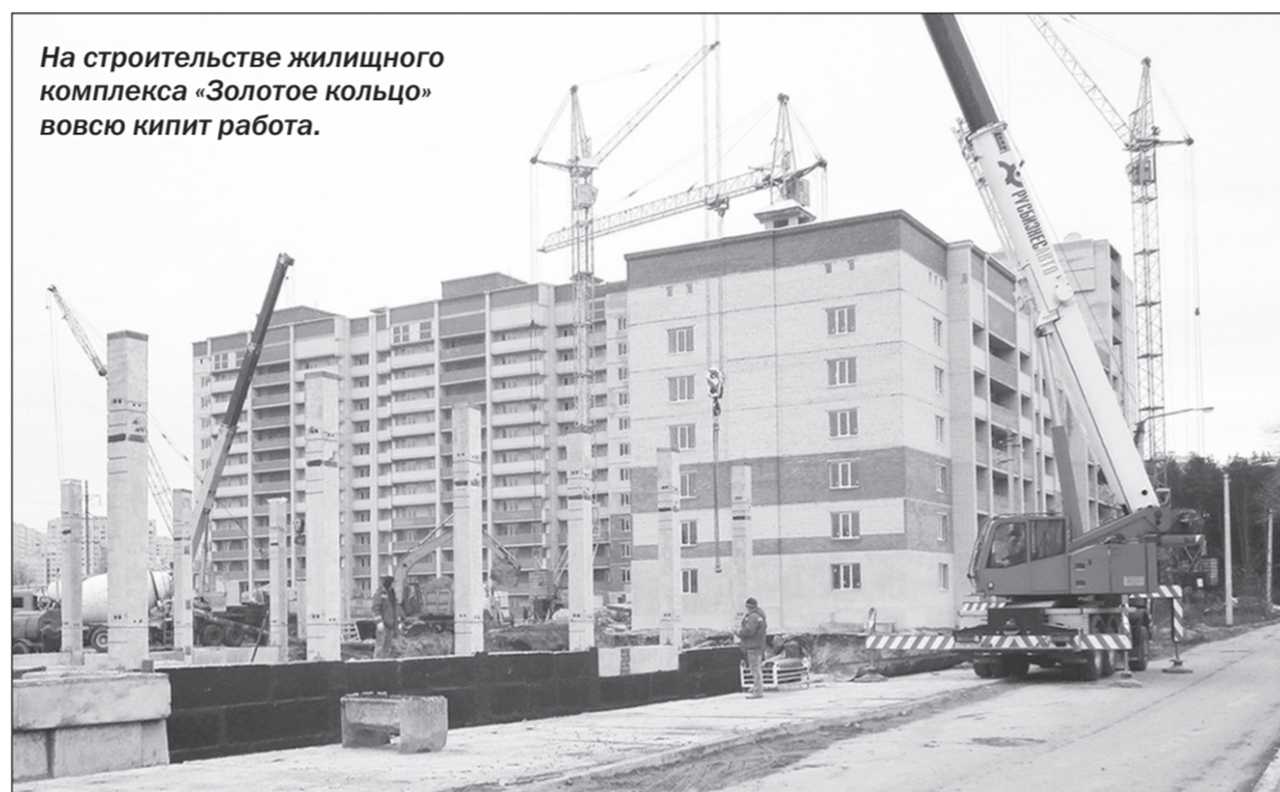
На строительстве жилищного комплекса «Золотое кольцо» вовсю кипит работа.

Приятные изменения происходят на строительной площадке жилищного комплекса «Золотое кольцо» (улица Антонова-Овсеенко, 35б). Здесь уже ряд зданий обрели крышу, и теперь симпатично смотрят на мир белыми пластиковыми окнами. А ведь только в конце прошлого года компания ООО предприятие «ИП К.И.Т.» привлечена в качестве подрядной организации для завершения строительства домов недобросовестного застройщика, оставившего без квартир более пятисот обманутых дольщиков.