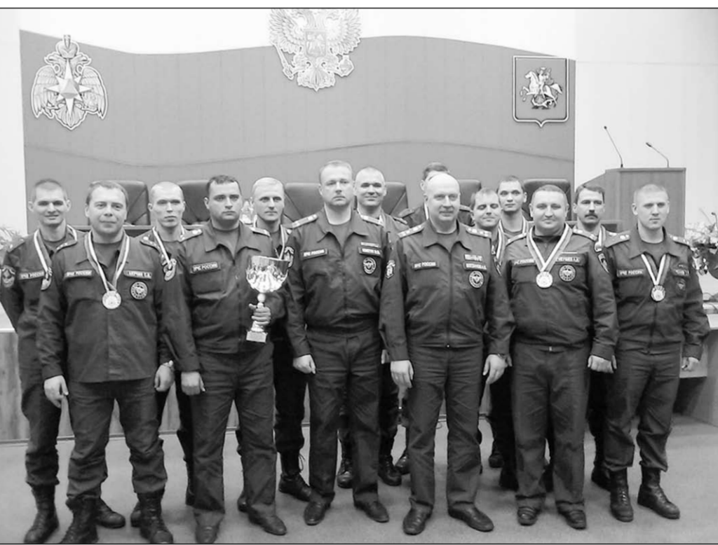
Команда-победительница на награждении в Подмоскowie.

— Насколько важны такие соревнования для личного состава? — адресуя вопрос начальнику Управления по-