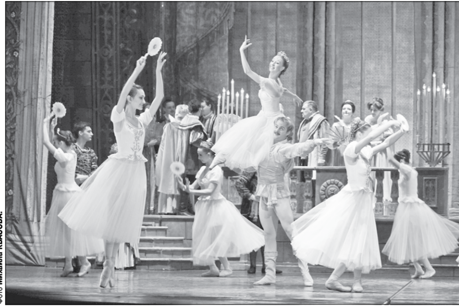
Сцена из первого акта постановки «Балетные шедевры в оперной классике».

Теперь воронежцам предстоит выезд по маршруту: Саров — Балашиха — Рязань, после которого программа первого круга будет завершена.