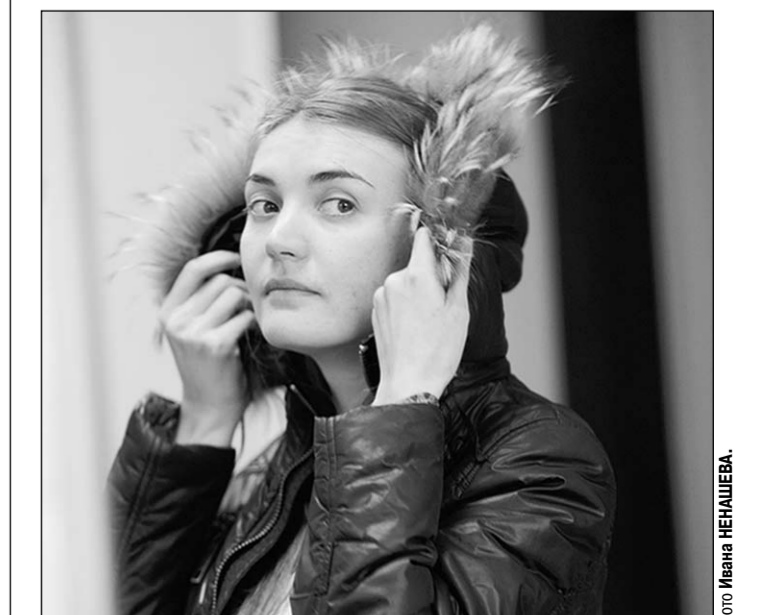
«И куртка чистая, и мех посвежел!»

И ещё. Чистка пальто мне обошлась в 730 рублей (это средняя цена по городу), пуховика – в 700 рублей (можно найти за 640), а чистка искусственной дублёнки – почти 850 рублей. Поскольку обошла я химчисток немало, то могу с уверенностью сказать, что где-то можно найти чуть дешевле, где-то – намного дороже. Выбирать всё равно вам. Я предпочла пункт рядом с домом, но у вас могут быть свои соображения на этот счёт.