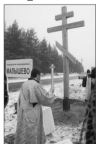
Поклонные кресты устанавливаются вокруг городов и поселений как защиту от разных бед.

Вчера на границе двух микрорайонов Малышево и Тенистый Советского района Воронежа по инициативе местных жителей установили поклонный крест.