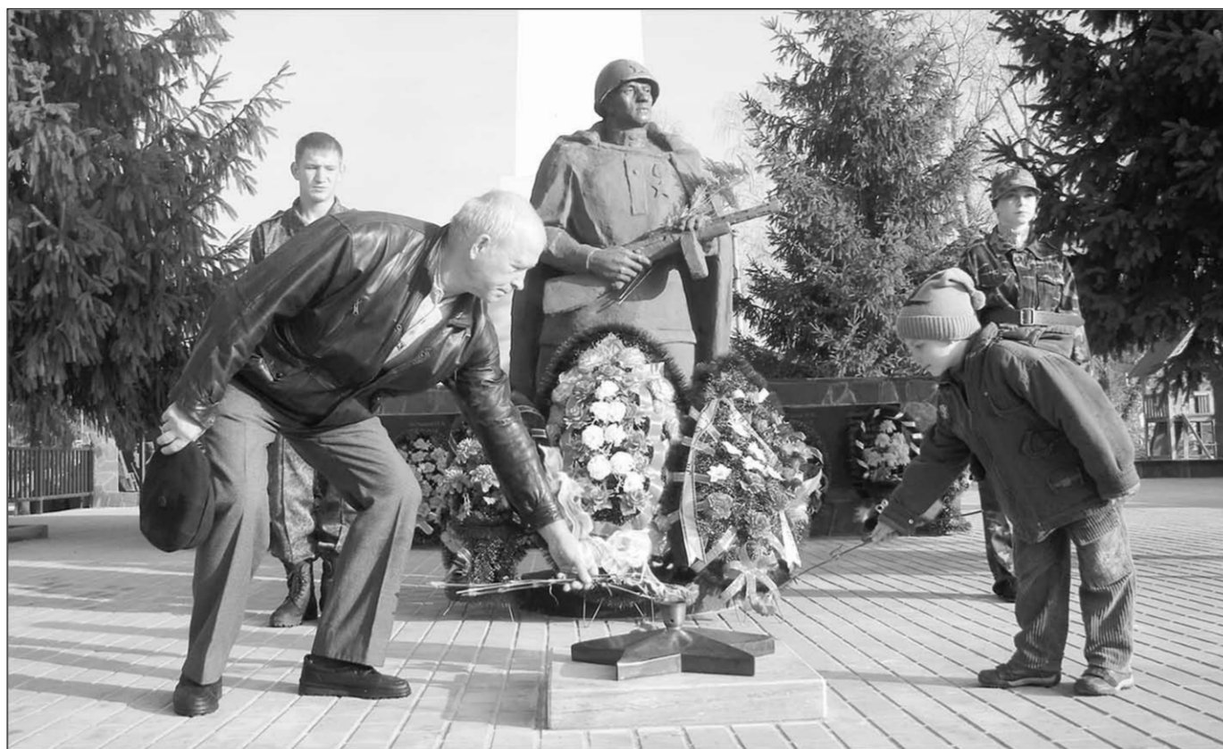
Цветы – к мемориалу защитникам родной земли.