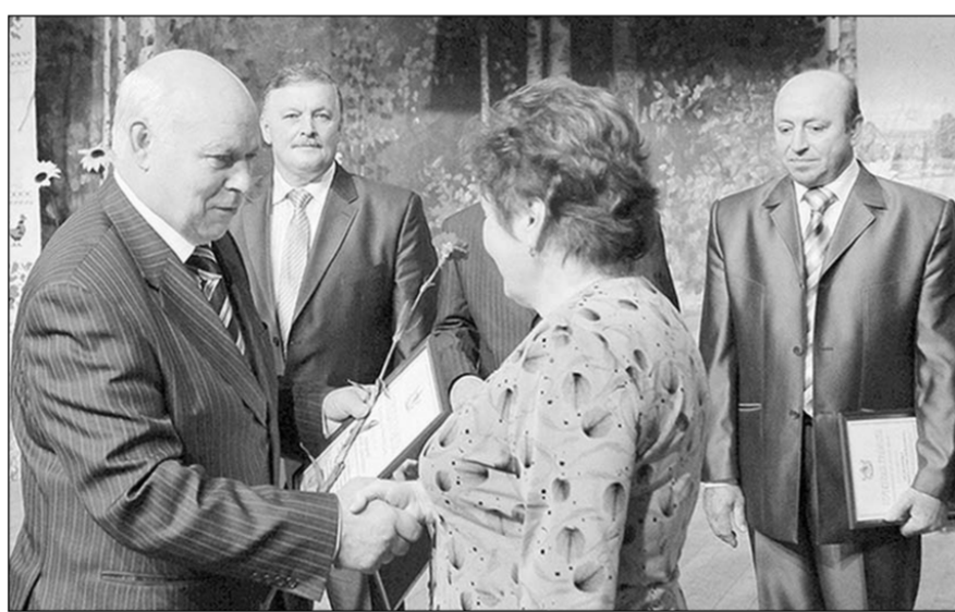
Благодаря труженикам сельскохозяйственной отрасли район демонстрирует уверенное развитие.

При этом спикер подчеркнул, что району стоит обратить внимание на такие проблемы, как низкое поголовье скота и убыль населения, показатели по которым определяют уровень раз-