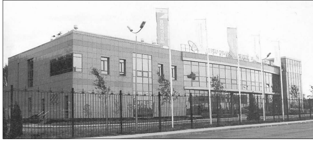
Медицинский центр ранней диагностики и лечения онкологических заболеваний.

Мы переходим из одного зала в другой и Чевардов знакомит со специалистами,