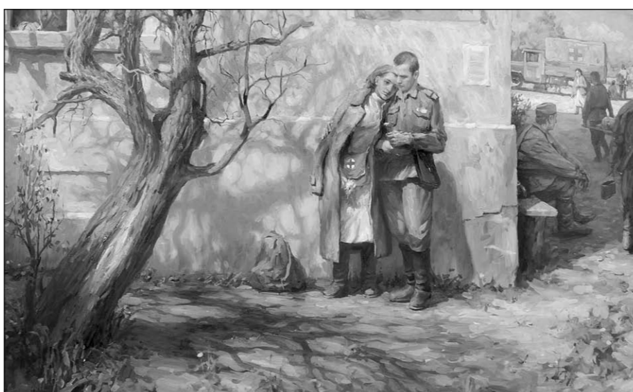
И.Аукжигитов (Пенза). «Последняя встреча».

3 декабря - Международный день инвалидов