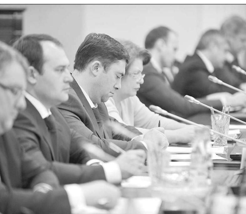
Члены правительства обсудили ряд важных проблем.

На заседании облправительства утверждены представлений руководителем департамента имущественных и земельных отношений Воронежской области, назвав ее высокоэффективной.