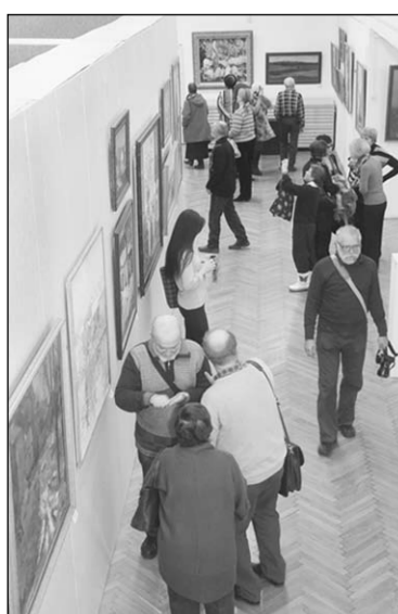
На открытии выставки.

Тамбовский дождь и занесённые крыши деревянных домиков, подсолнухи и мосты, граничные гнезда — и радуга после дождя. Нашлось тут место и для православных икон, и для живописного посещения автору «Медного всадника» и «Евгения Онегина», и для трогательного подражания Ване Югу. А вот простой мужик в майке «играет» на баяне. Похоже, что для вон той милой романтичной девушки, портрет которой привезли ещё откуда-то. Мы, конечно, не слышим его игры, но не к ней ли прислушивается нарисованная девушка?