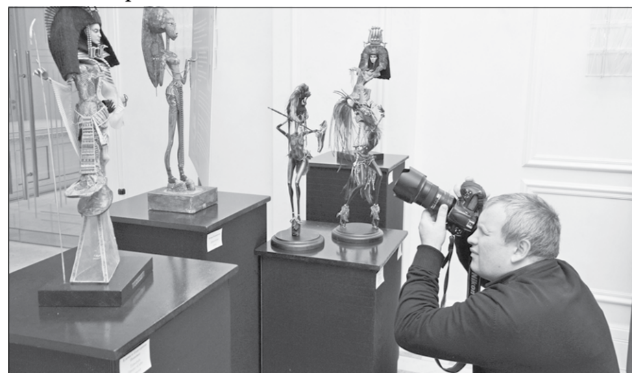
Первыми посетителями выставки стали журналисты.

На воронежской представлены самые разные направления современного искус-