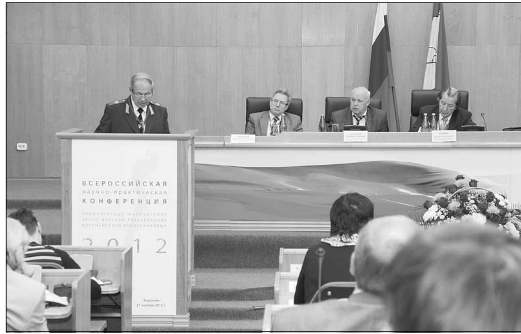
Обсудить проблемы Воронежского водоохранилища на конференции собрались более 200 специалистов из разных регионов России.

Из-за обмеления в верховье водоохранилища образовался болотный массив. Здесь площадь зеркала воды уменьшилась на пять квадратных километров, а доля мелководий превышает 60 процентов. Исследования, проведенные в районе расположения водозабора, показали, что большое содержание железа, марганца, сероводорода, нефтепродуктов в донных отложениях связано именно с этим болотным массивом. Опасность пред-