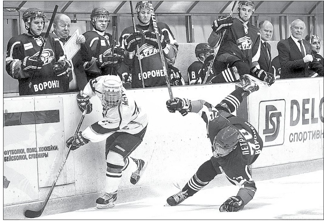
На крутых виражах.

Пропустив одну шайбу в первом периоде, воронежцам