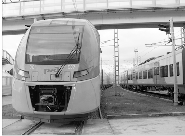
Новый электропоезд «Ласточка».

Она свяжет Адлер, ледовые дворцы Олимпийского парка и Красную Поляну. Пропускная способность железной дороги - 8,5 тысячи пассажиров в час, автомобильной - 11,5 тысячи. Поездка на новом электропоезде «Ласточка» до конечной остановки в горах - станции «Красная Поляна» займёт менее получаса. Планируемая пропускная способность железной дороги - шесть пар поездов в час, а их скорость составляет до 160 километров в час.