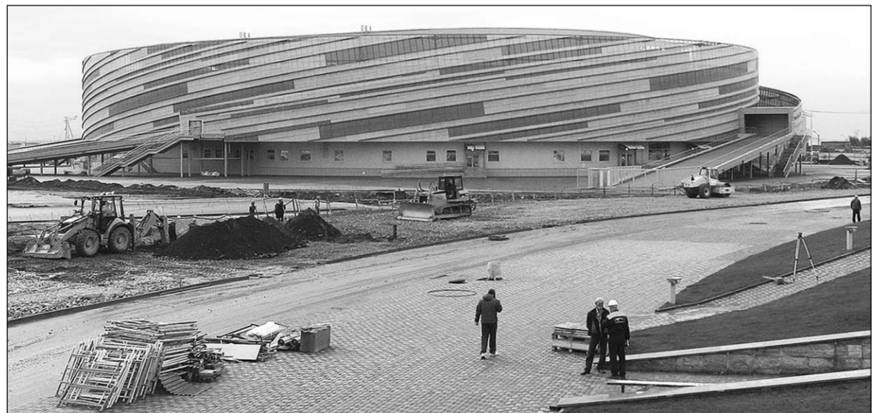
Ледовая арена «Шайба».

Когда я сошла с трапа самолёта, сразу почувствовала густой пьянящий аромат южного вечера. В Воронеже и Москве - мороз и снег, а здесь - запах моря, роскошных магнолий и... предчувствие большого праздника.