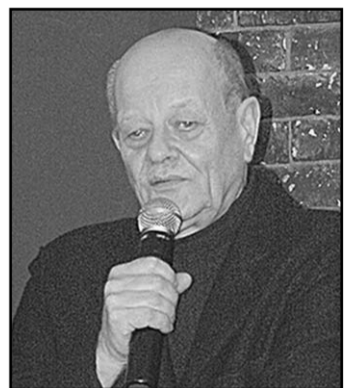
Родерик де Ман.

В России де Ман уже во второй раз. В 2004 году он провёл здесь большое концертное турне. Россия де Мана понравилась. В том числе и потому, что «здесь всё большое»: намного больше, чем на его Родине. Многолетнее сотрудничество связывает его с Московским ансамблем современной музыки. Ряд сочинений он написал специально для этого коллектива. Одно из них так и называется: «Музыка для русских друзей». На встрече в турумов