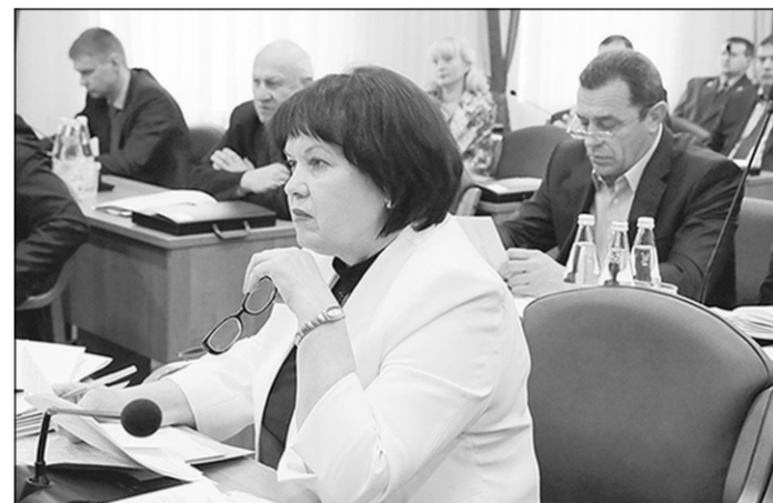
На очередном заседании депутаты рассмотрели 22 вопроса.

На заседании были утверждены Правила депутатской этики. Документ определяет нормы поведения депутата гордумы в соответствии с общепринятыми этическими нормами социального поведения при исполнении ими депутатских полномочий,