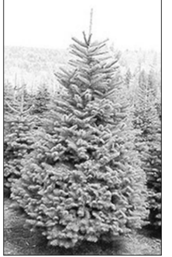
О такой ёлочке мечтают многие.

Если мороз на улице ниже -10^{\circ}\text{C} , не носите ёлку сразу в