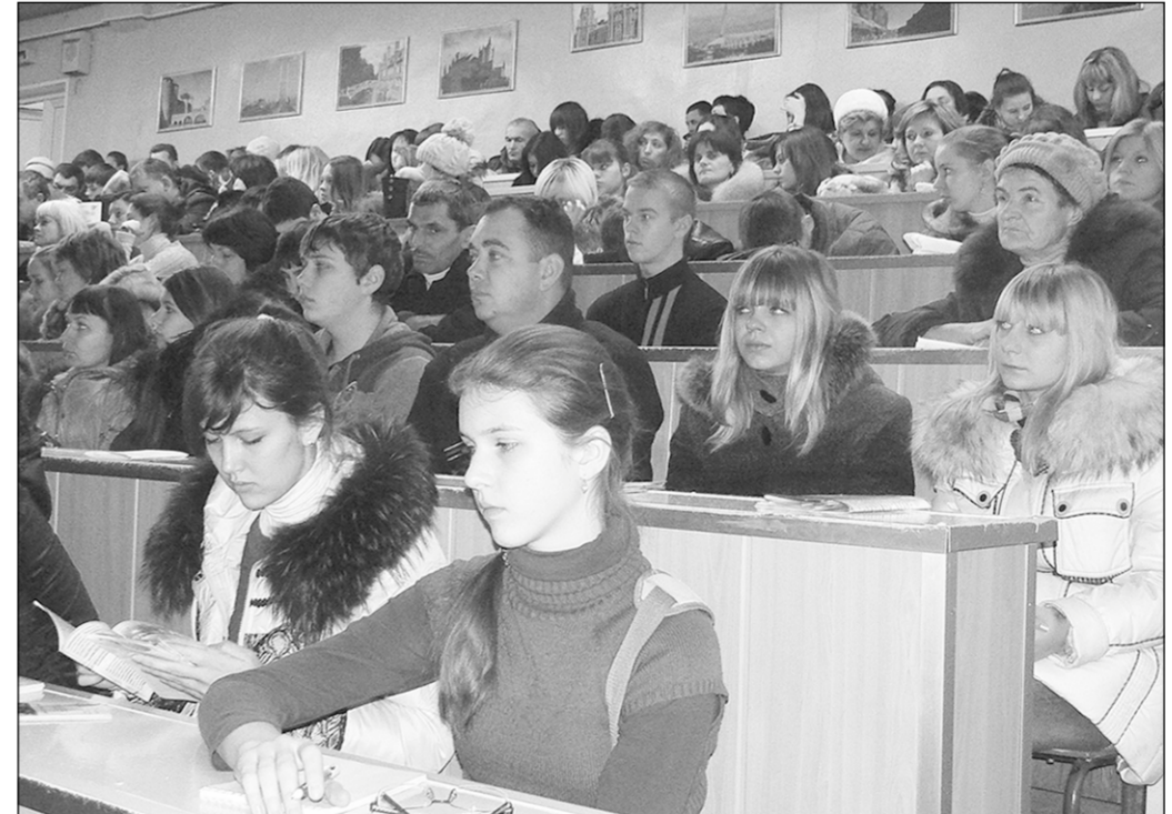
Строительные профессии всегда востребованы.

Подготовили: Елена ЗЕЛИКОВА, Наталья СТОЛПОВСКАЯ.