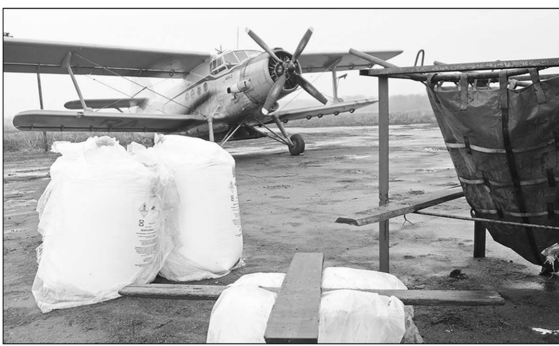
Для аграриев сейчас всё дорого: и удобрения, и авиация.

аналогичная информация от 16 мая 2012 года. Тогда ОАО продекларировало возможный максимальный уровень отпускных цен на второе полугодие 2012 года. Обратимся к информации для сравнения: аммиачная селитра - 7140 рублей за тонну, нитроаммофоска (азофоска) 16.16.16 - 13080 рублей за тонну.