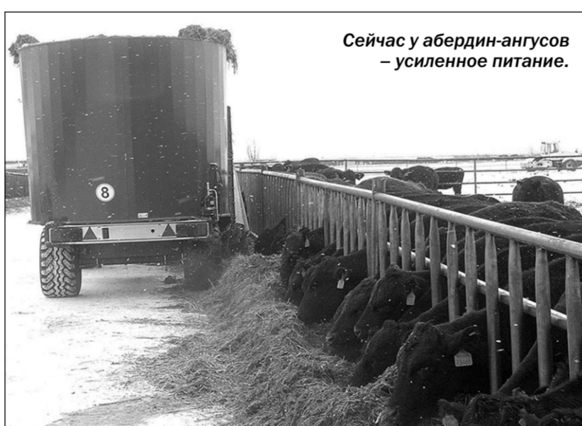
Сейчас у абердин-ангусов — усиленное питание.

В первое время, нельзя этого отрицать, были перебои с водой. Из-за дождей затруднилась подвозка кормов. Сейчас эти вопросы решены. Ежедневно скармливается по 120 тонн различных кормов. Это почти наполовину больше, чем предусмотрено нормами, так как нетели и телки из Америки и Австралии пришли в ослабленном состоянии. Сказалась долгая дорога, в первом случае — 18 суток,