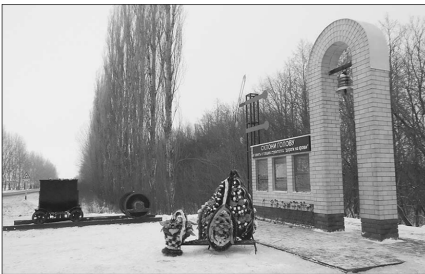
У этого памятника своя трагическая история.

Летом 1942 года немецко-фашистские войска оккупировали Правобережье Дона на территории Лискинского, Каменского и Острогожского районов. Взять узловую станцию Лиски не удавалось, что лишило немцев возможности срочной переброски военной техники и живой силы в район ожесточённых боёв под Сталинградом и на Кавказ. Руководством вермахта было принято решение о немедленном строительстве железнодорожной ветки Каменка-Острогожск протяжённостью 36 кило-