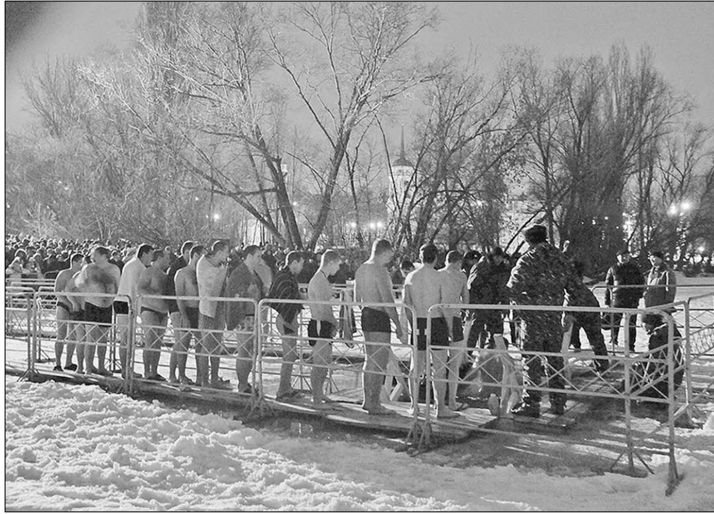
Такие очереди можно только приветствовать.

В Воронежской области богослужения прошли в 223 храмах, церквях и монастырях. Кстати, купание в прорубях в Крещение Церковным Уста-