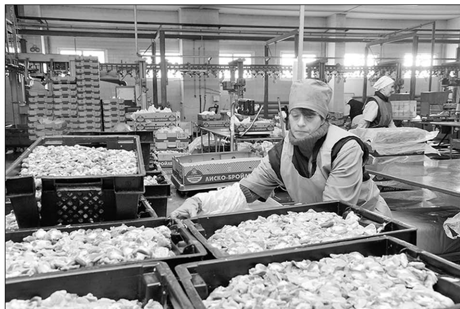
В одном из цехов ООО «ЛИСКО Бройлер».