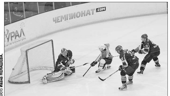
Шайба в воротах!

Что и говорить, в сложную ситуацию попали хоккеисты «Бурана». Ровно месяц остался до окончания регулярного чемпионата ВХЛ, а очки в последних играх даются нашей команде с огромным трудом. И если воронежцы не смогут занять место не ниже шестнадцатого, то дебютный сезон в высшей лиге они закончат досрочно.