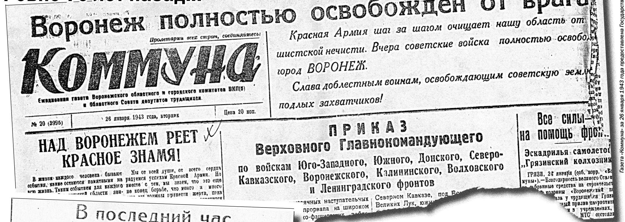
Газета «Коммуна» за 26 января 1943 года, посвященная Государственным праздникам общественной исторической истории Воронежской области.