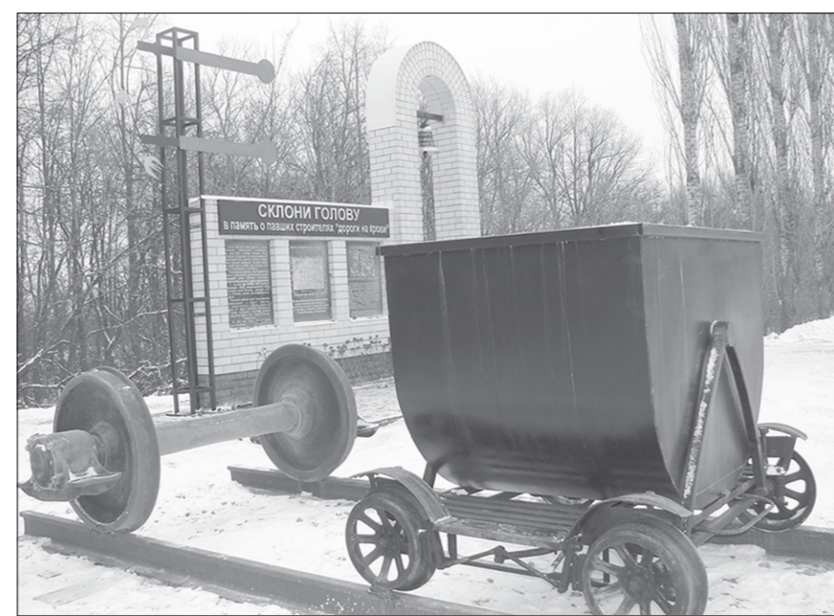
Мемориал замученным на строительстве «берлинки».