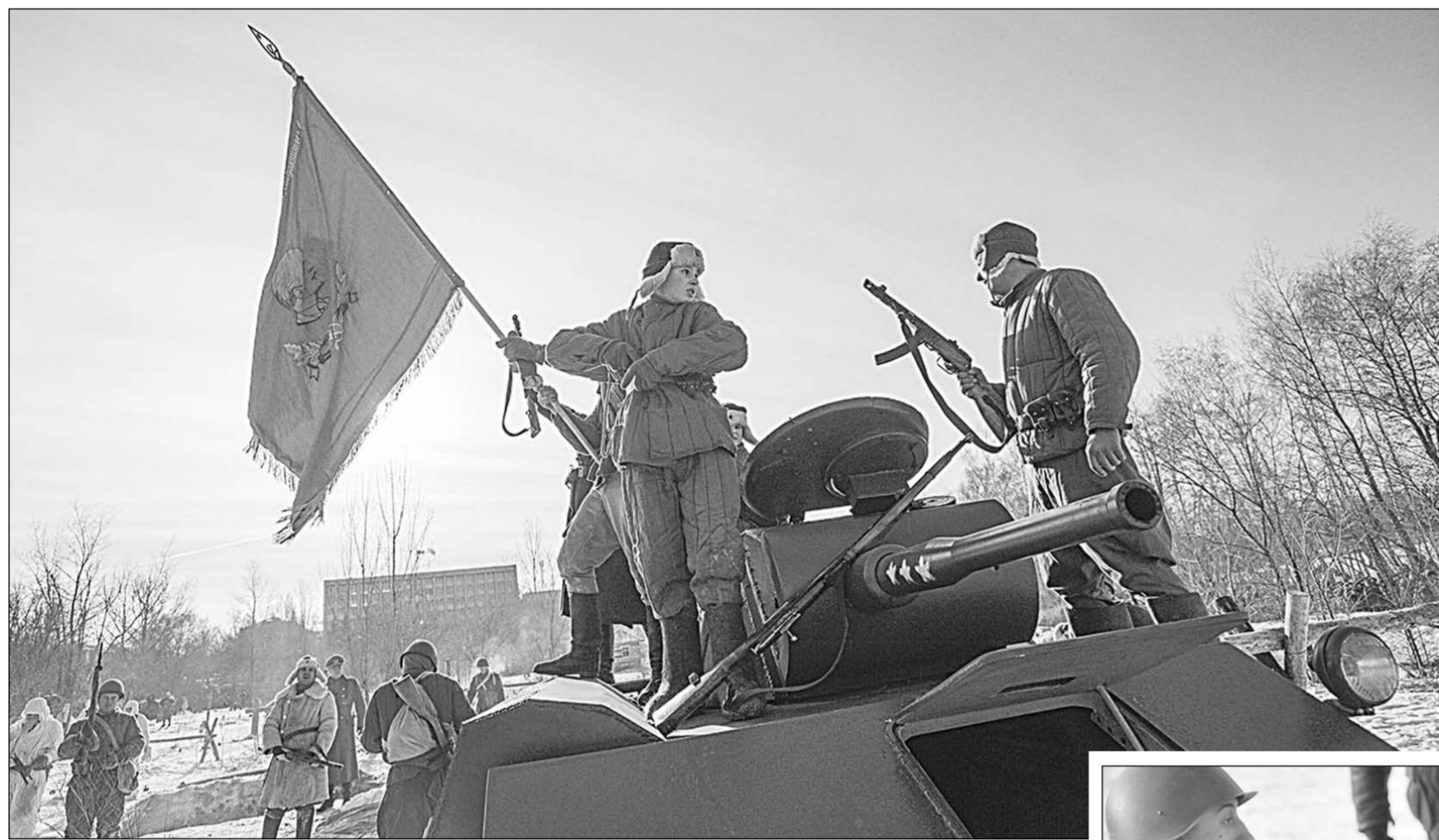
Победа советских войск на военно-исторической реконструкции боёв за Воронеж.

Помни, веруй, гордись! | Воронежцы широко отметили 70-ю годовщину освобождения города от немецко-фашистских захватчиков