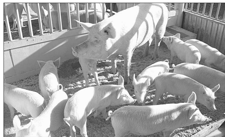
У хорошего хозяина свинка, как картинка.

Примечательно, что Владимир Маслов вторит Клеменсу Тённисесу: условия для инвесторов в Воронежской области являются одними из лучших в масштабах страны. Безусловно, иностранные и отечественные инвесторы всё просчитывают, прежде чем вложить свои капиталы в свиноводство. Помимо лояльности властей во внимание берутся почвенные, метеорологические и транспортные условия, а прежде всего — относительная меньшая капиталоемкость производства и доставки продукции в такой крупнейший потребительский регион, как Московский. Высокая платежеспособность жителей столицы позволяет инвесторам рассчитывать на довольно объёмный сектор гарантированного сбыта здесь экологически безопасной воронежской свинины.