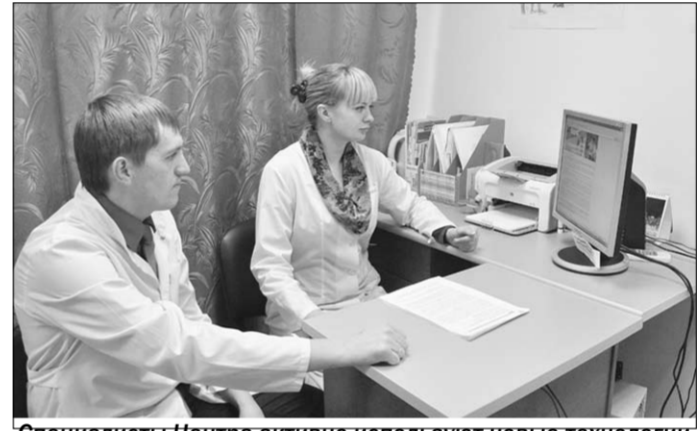
Специалисты Центра активно используют новые технологии.

Не менее опасно и нарушение обмена веществ. Поданным Российской академии медицинских наук, в нашей стране каждый второй имеет лишний вес, а каждый пятый – болен ожирением.