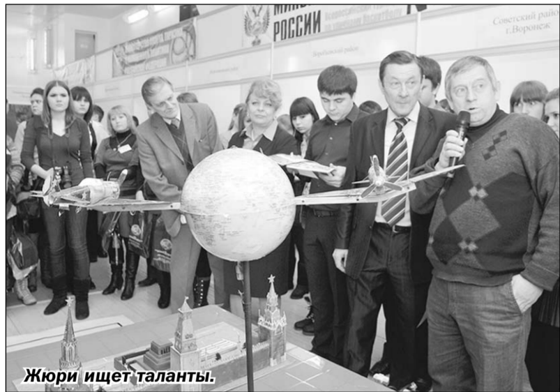
Жюри ищет таланты.

Высшее образование | В Воронежском государственном университете инженерных технологий прошёл III Молодёжный инновационный форум Воронежской области