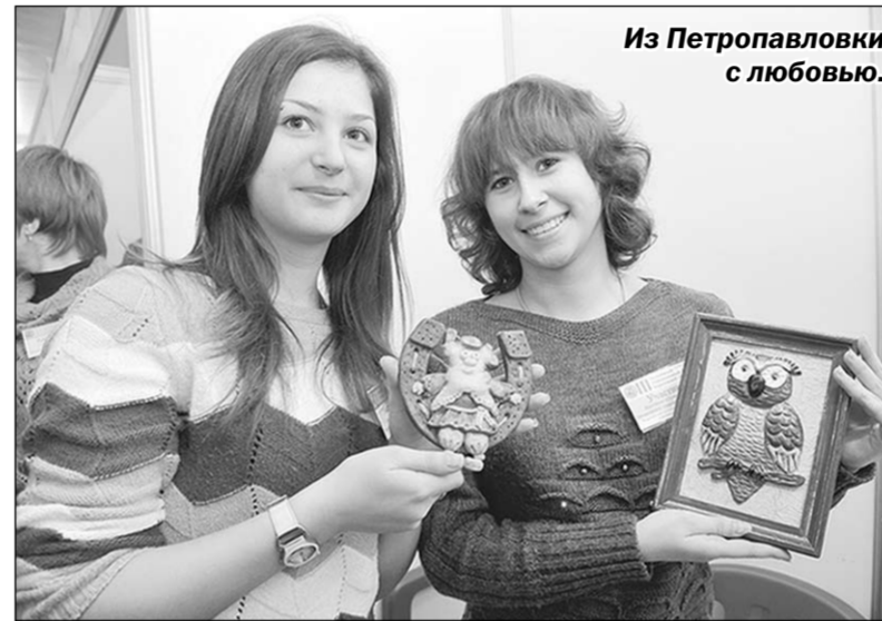
Из Петропавловки с любовью.

– А мы тем временем уже приступили к работе над следующим инновационным агрегатом под условным названием «электрический венчик». Второй год вынашиваем эту идею. Аналогов нет ни в России, ни за рубежом. Значит, предстоит самим мудрить как над внешним видом, так и над внутренним устройством. Получается далеко не сразу. Бывает,