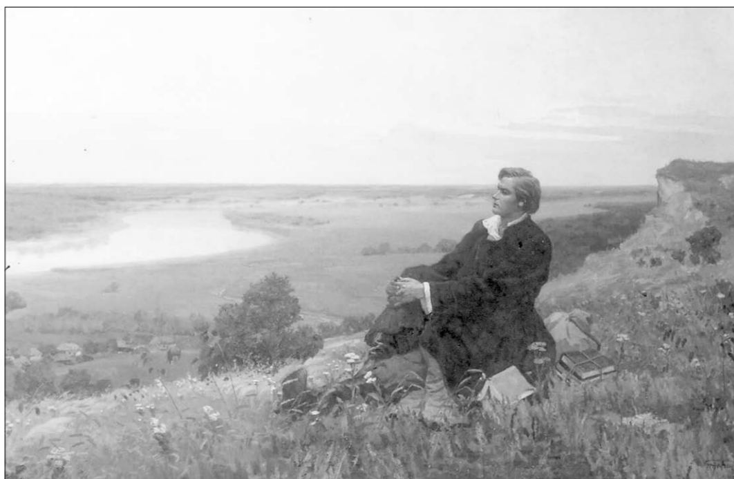
Картина Григория Гончарова «Юность поэта».

К сожалению, в самые последние годы жизни навалившиеся болезни и резко ухудшившееся материальное положение вынудили художника около полустотни своих картин (и далеко не худших!) продать за рубеж. А покупали их западные ценители весьма охотно. Таким образом, какую-то часть творческого наследия живописца воронежцы уже больше никогда не увидят. Но даже то, что осталось, вполне даёт представление об истинном таланте художника Г.А. Гончарова.