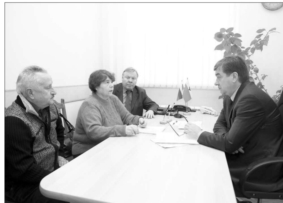
Мэр прислушивается к мнению воронежцев.