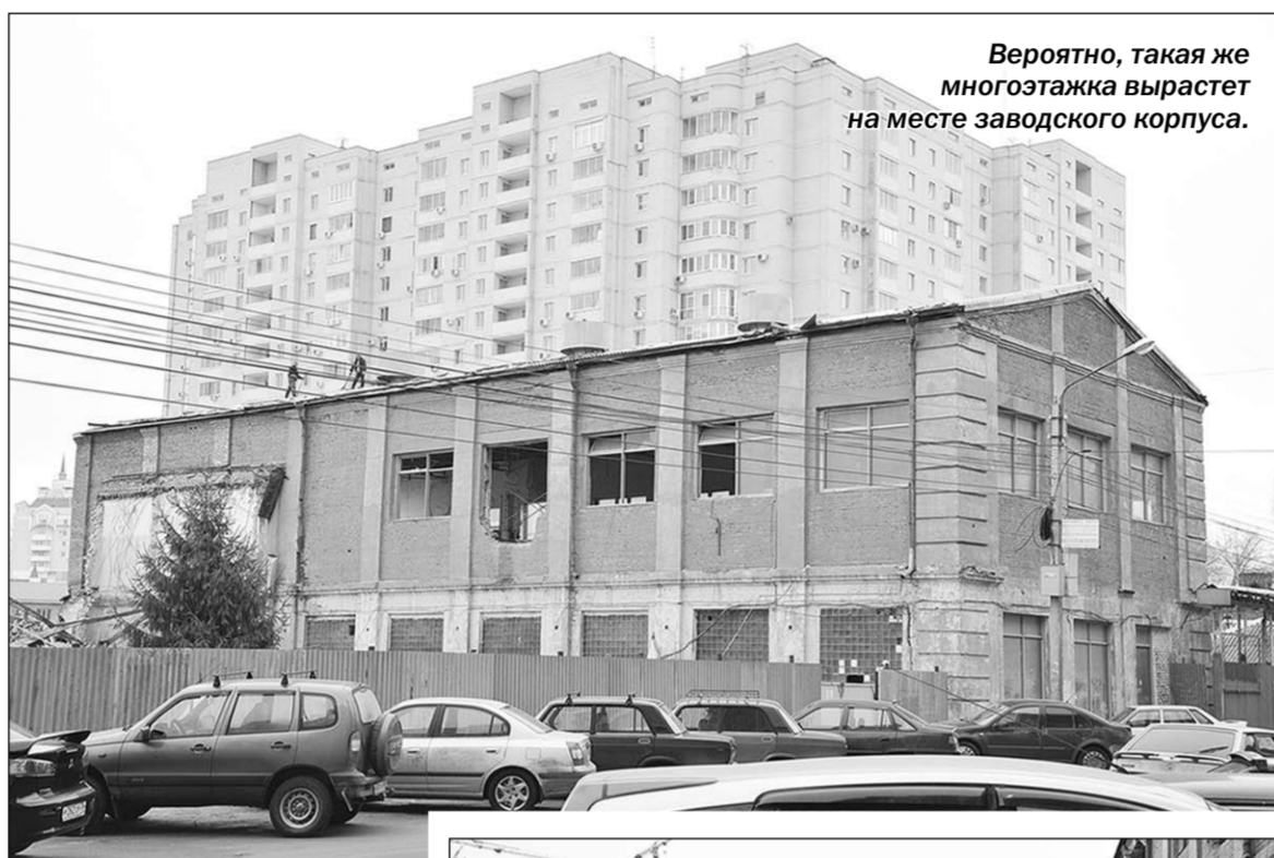
Вероятно, такая же многоэтажка вырастет на месте заводского корпуса.

Основные сведения об истории этого места я почерпнул из книги «Историко-культурное наследие Воронежа», выпущенной в 2000 году. Если когда-то осуществится исправленное с учётом новейших данных её переиздание, страницы о здании на улице Революции 1905 года придётся исключить: в прошлом году начался снос бывшего завода. В эти дни он близится к