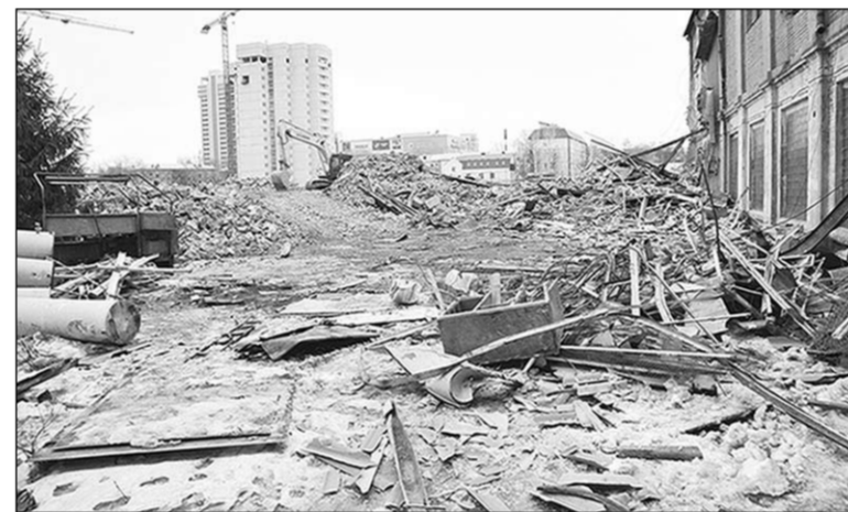
Здесь был трубочный завод.

В дни, когда писалась эта статья, от заводского корпуса осталась лишь правая часть. Прочее