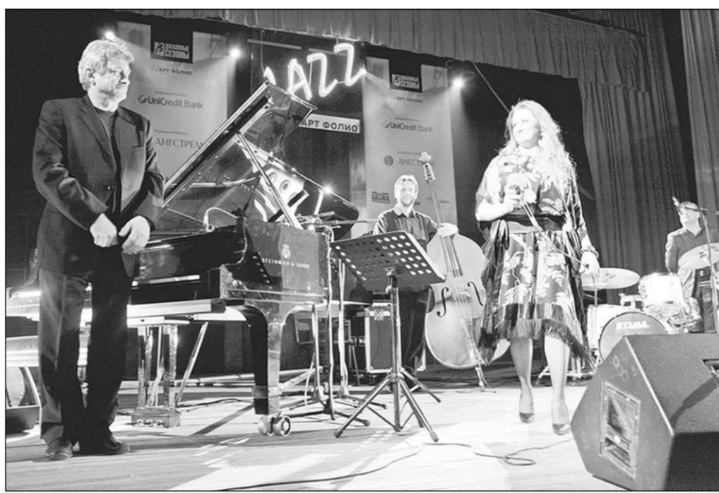
Польские музыканты на сцене Воронежской филармонии.