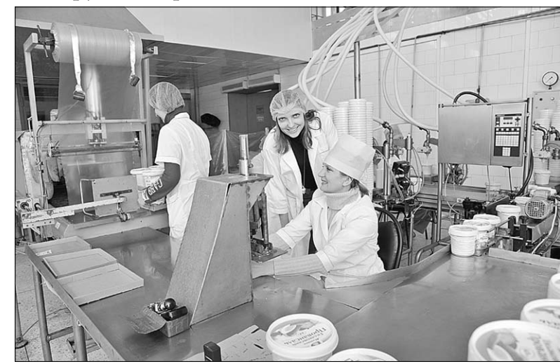
Реконструкция производства идёт быстрыми темпами.

Приятно считать, что маргарин – универсальный продукт, он широко применяется для приготовления теста, заправки первых и вторых блюд, обжаривания мяса, картофеля и овощей. Чтобы соответствовать постоянно растущим