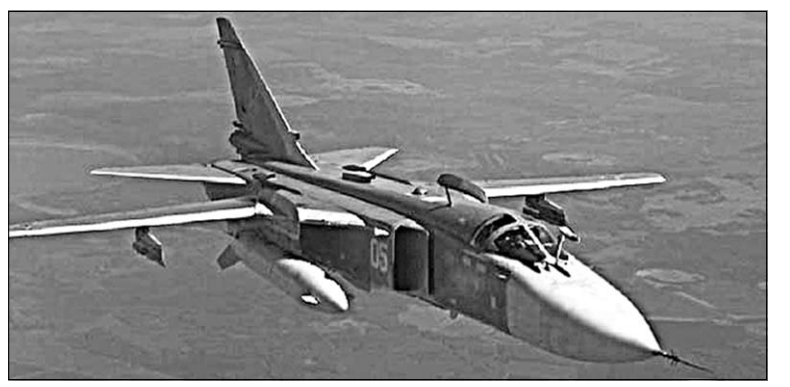
Su-24 в полёте.