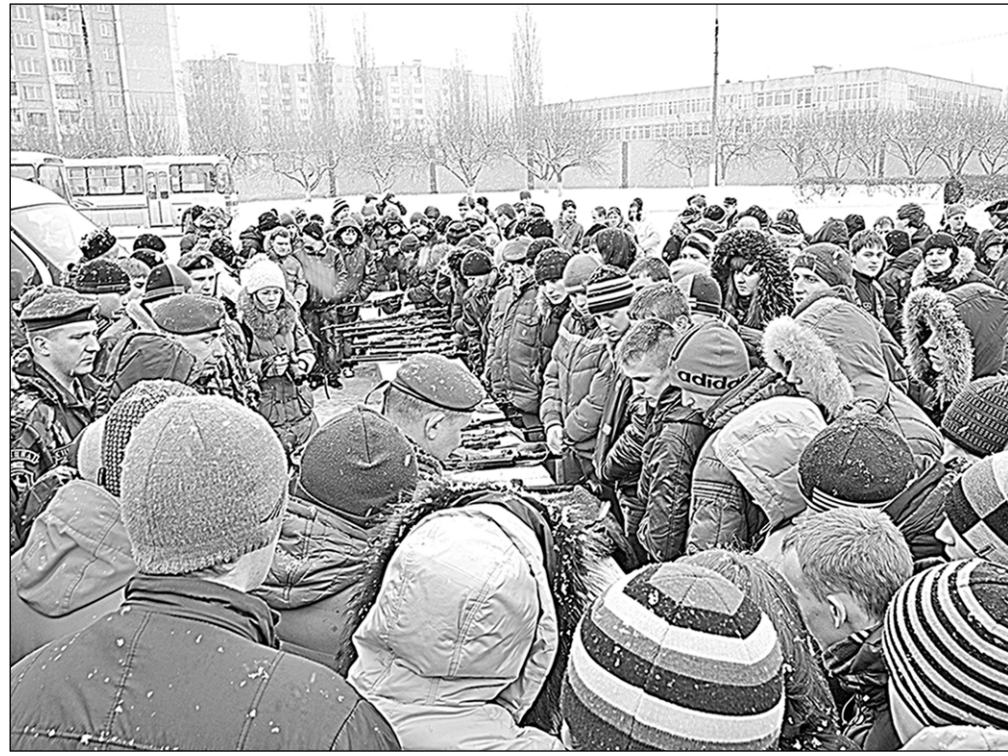
У будущих воинов особый интерес вызвали образцы стрелкового оружия.

До весеннего призыва ещё больше месяца, вчера на областном сборном пункте собралось почти триста ребят из Воронежца и близлежащих районов. Областной военкомат в преддверии Дня защитника Отечества решил будущих призванных с праздником поздравить, а заодно и познакомить их со стрелковым оружием.