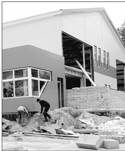
Возведение ФОКа в посёлке Слобода Бобровского района.