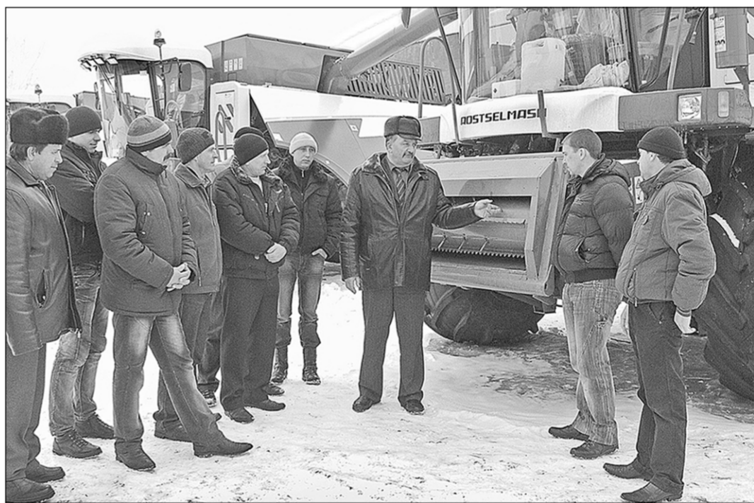
Зимние уроки летней страды.

Десять-пятнадцать минут теории, вопросы-ответы, снова теория, снова вопросы — ответы, потом занятия непосредственно у комбайнов, с их запуском и прокруткой в разных режимах, — и слушателем становится ясно, как за счёт каких технических