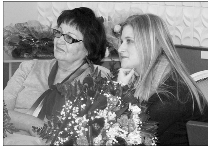
Жена и внучка космонавта.

В среду, 27 февраля, Анатолий Филипченко обиделся со школьниками и молодежью города. На встречу, которая прошла в стенах средней школы №2, пришли учащиеся и педагоги школ города Острогожска. У молодых была возможность в неформальной обстановке пообщаться с героем космоса.