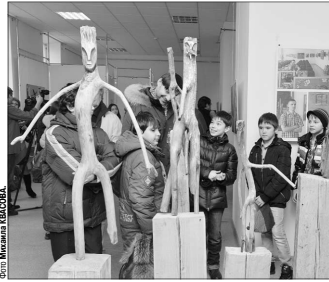
Экспонаты очень понравились детям.

Вернисаж | Выставка с таким названием открылась в зале воронежской организации Союза художников России