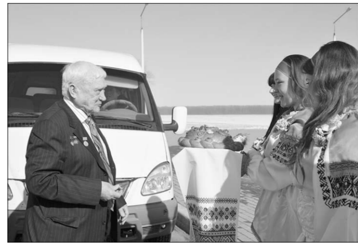
Хлеб-соль от земляков-острогожцев.

22 октября 1969 года орденом Ленина и ему присвоено звание Героя Советского Союза. 11 декабря 1974 года орденом Ленина и второй медалью «Золотая Звезда» Героя Советского Союза. Орденом Знамени Венгерской Народной Республики первой степени с бриллиантом. Золотой медалью имени К.Э. Циолковского Академии наук СССР. Лауреат Государственной премии СССР. Почётный гражданин города Острогожска и пгт. Давыдовка, а также городов Калуга, Караганда, Липецк, Чита, Аркалык (Казахстан), Сумы (Украина), Хьюстон (США).