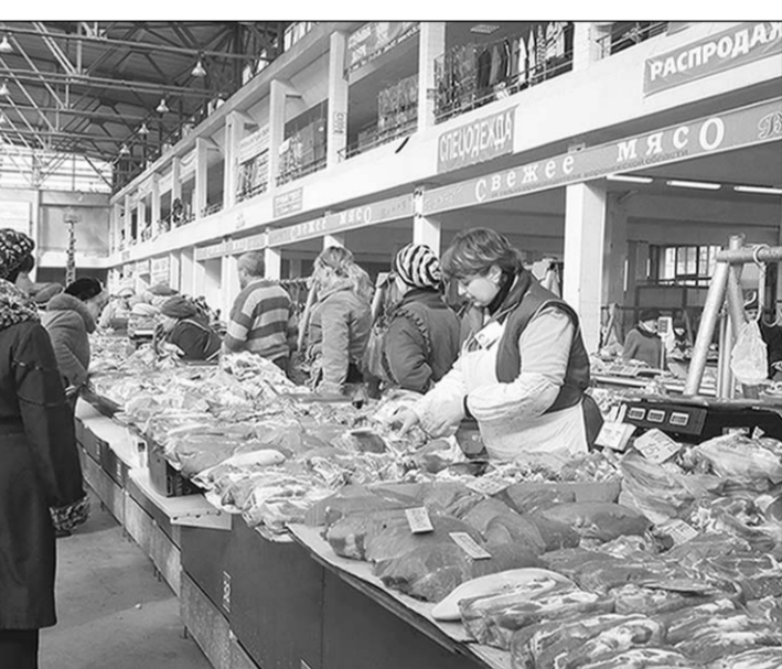
Знакомая картина изменится только в лучшую сторону.

Имевшийся проект реконструкции актуален, одобрен градостроительным советом, прошел госэкспертизу, поэтому специалисты ориентировались на него. Фактически рынок будет возведён вновь в тех же геометрических параметрах, возможен снос старого здания, поскольку добавляется два уровня парковки - по 400 машиномест на каждом. Этот вопрос будет изучать специалисты дополнительно. Рассматривались варианты с большим количеством мест, но необходимо было соблюсти баланс с торговыми площадями. Предложенные сейчас проектные решения таковы, что, несмотря на органи-