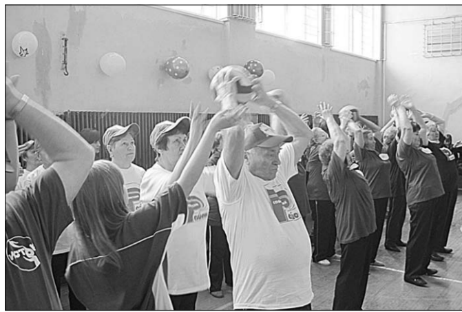
Пусть будет сила в наших руках!