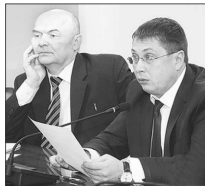
В президиуме учёного совета.

Вчера в Воронежском государственном университете прошёл учётный совет, принявший без преувеличения историческое решение о вхождении в состав ВГУ Борисоглебского государственного педагогического института. В скором времени интеграция с ВГУ ожидает и Воронежский филиал Финансового университета при Правительстве РФ.