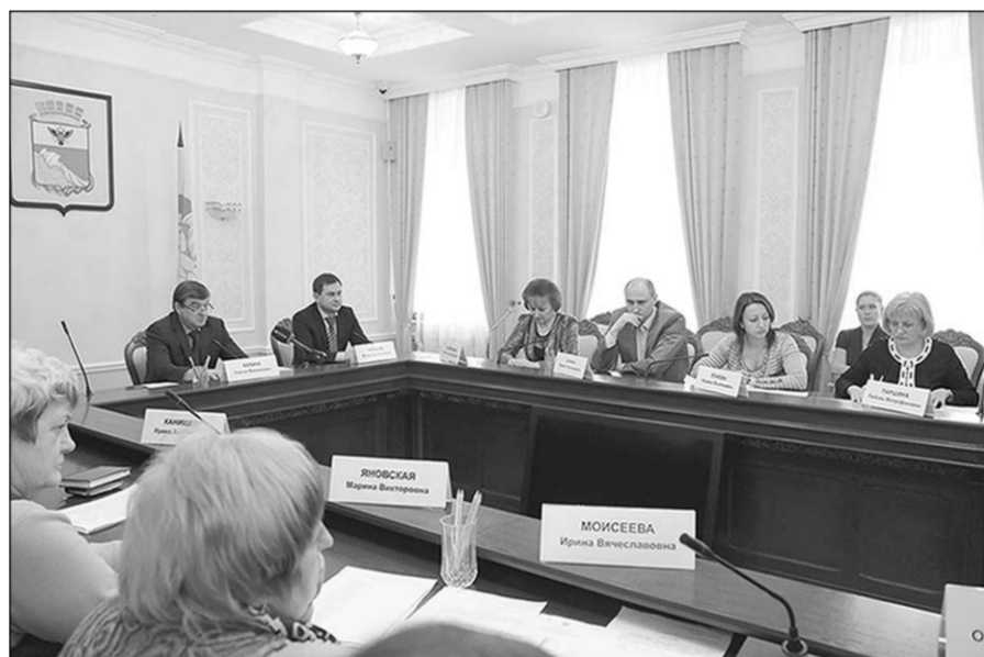
Диалог - взаимозаинтересованный.