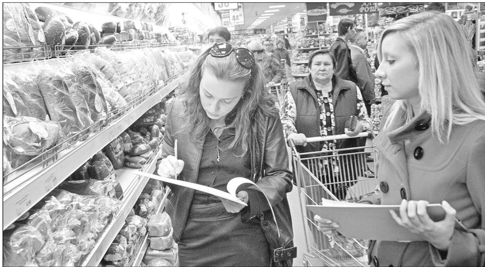
Согласны ли воронежцы с тем, что они живут в городе с низкими ценами?

На злобу дня | По оценке российской Общественной палаты, Воронеж входит в тройку городов с самым низким уровнем ... цен на социально значимые продукты и услуги