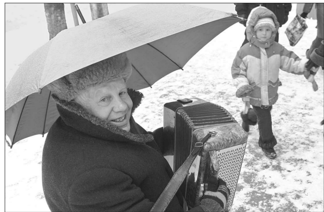
Уличный музыкант дядя Вася - большой оптимист.

На сознательность бизнесменов, в том числе в вопросе выплаты «белых» зарплат, рассчитывают и депутаты областной думы, которые проголосовали 4 декабря 2012 года за то, чтобы прожиточный минимум для установления социальных доплат к пенсиям, предусмотренным федеральным законодательством, составлял в 2013 году не 4675 рублей, как это было в четвёртом квартале года предыдущего, а 5947.