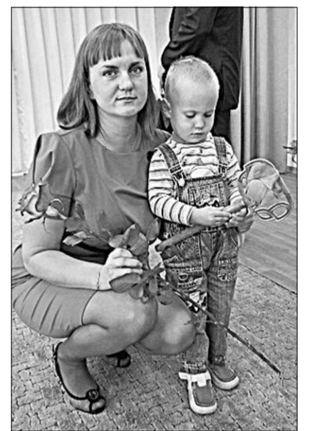
Открытие детского сада в Александровке.

Открытие нового детского сада – редкая в наше время радость. Совсем недавно она пришла и к жителям Новоусманского района, на карте которого теперь есть такой адрес, как «Центр развития ребенка – детский сад «Радуга». Детское дошкольное учреждение на 150 мест призвано помочь в решении проблемы очередей в детские сады района. Кроме этого, «Радуга» – это ещё и уникальный, не имеющий аналогов развивающий проект. В помещениях Центра развития для малышей оборудованы спортивные и музыкальные залы, пищеблок, спальне комнаты, помещения для занятий. Все работы по оснащению детского сада выполнены в соответствии с современными требованиями, предъявляемыми к дошкольным учреждениям. Есть у «Радуги» и свой автопарк: автобус, подаренный администрацией района и администрацией Отраденского сельского поселения.