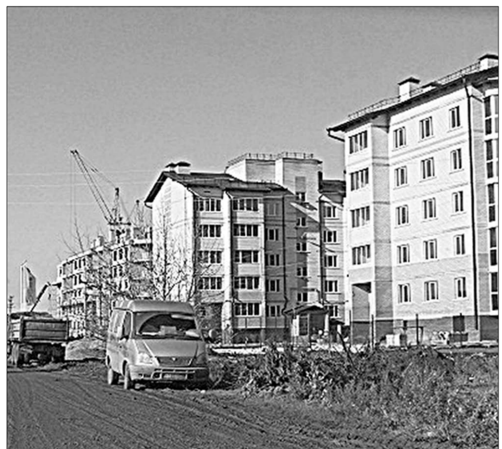
Новый жилой квартал в Отрадном.