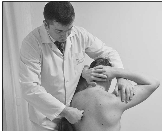
Комплексное лечение начинается с тщательного обследования пациента.

Европейская клиника «Сиена-Мед» предлагает современные методы лечения позвоночника и суставов