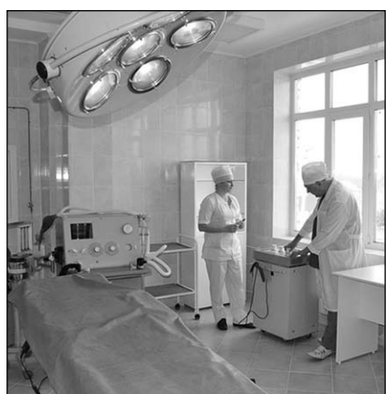
В операционном блоке.

С недавних пор грибановские хирурги делают операции в новых комфортных условиях. В ЦРБ проведена полная реконструкция оперблока, который включает в себя три операционных. Средства на это были выделены по программе модернизации здравоохранения и при софинансировании из районного бюджета. Надо сказать, что операционные давно нуждались в ремонте. Помещения не только обветшали, но и оперировать в них было трудно: летом из-за жары, а зимой из-за холода.