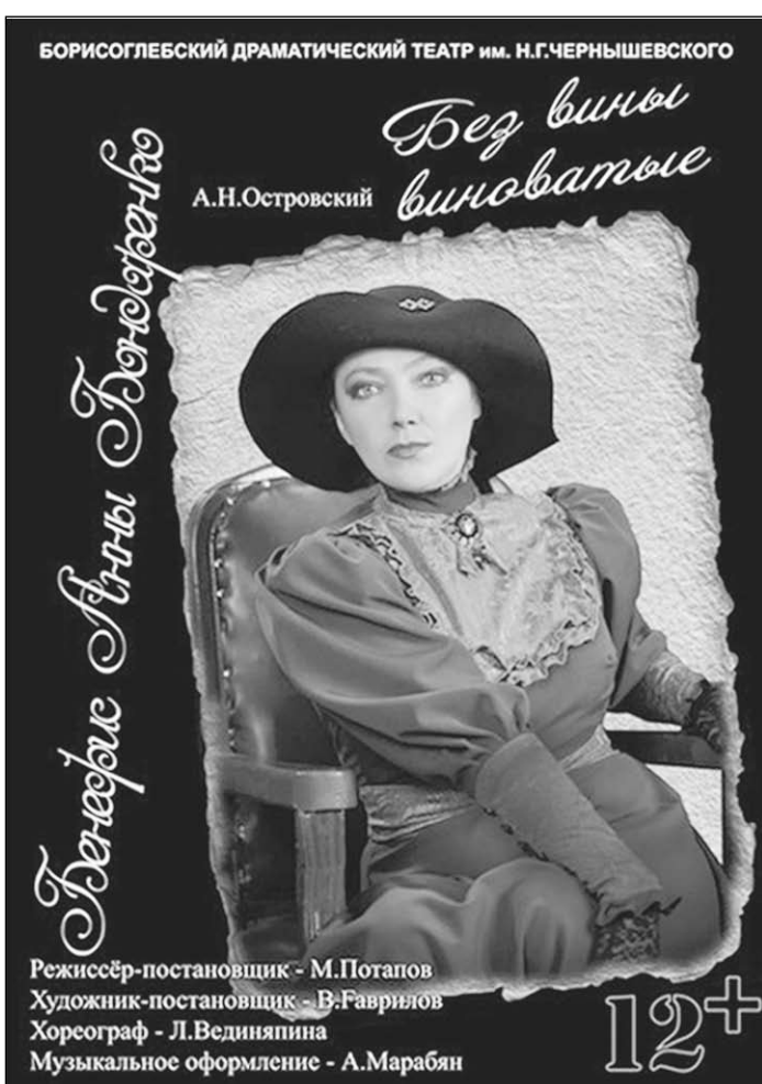
Афиша премьерного спектакля.