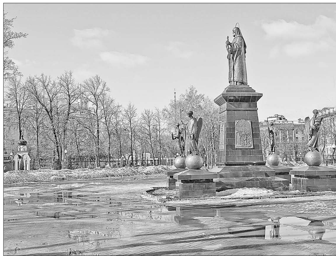
Памятник святителю Митрофану.

Вернисаж | В один день в Воронеже открылись сразу две персональные фотографические выставки