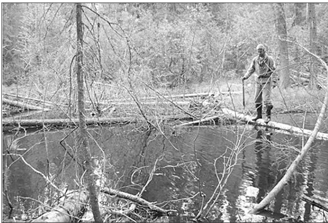
Реки, горы, непроходимые топи и болота — нередко лежат на пути геолога.