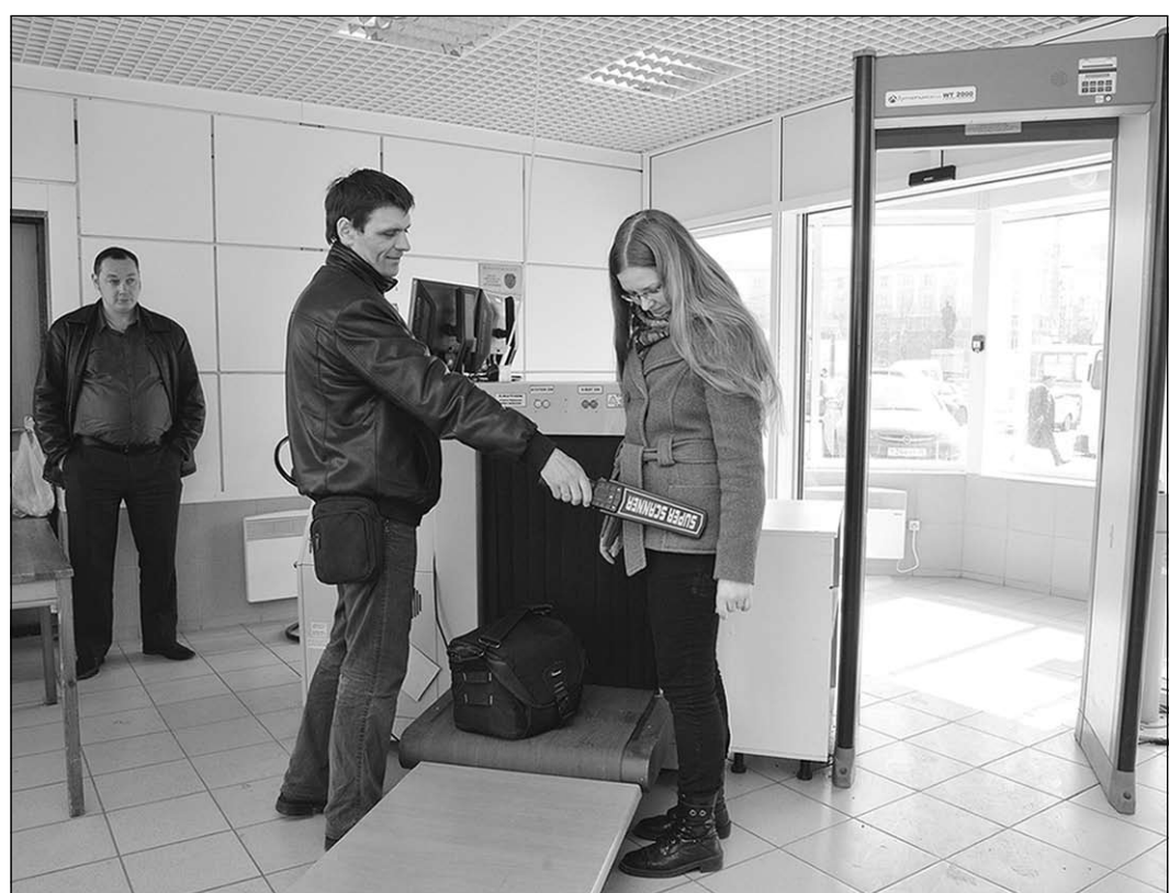
Работу металлодетектора корреспондент «Коммуны» испытала на себе.

У всех на слуху | Проверка ручной клади или багажа передовыми техническими средствами с этого месяца становится привычным делом на центральном железнодорожном вокзале Воронежа