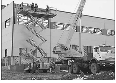
На возведении объектов АВП.

Его стоимость два миллиарда рублей. Сейчас интенсивными темпами возводится здание, в котором будет располагаться сварочно-монтажный участок АВП – теплый гараж с аварийно-ремонтной зоной и открытой стоянкой для техники.