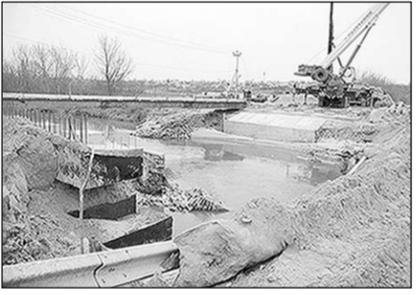
Идёт строительство моста.

На территории Гиндовского сельского поселения возводит мост через речку Полубанку. Мост длиной 24 метра и шириной 15,6 метра будет двухполосным, по обе его стороны сделают трехмерные пешеходные дорожки. Железобетонная переправа сможет пропускать машины любой грузоподъемности. Ливневку по мосту оборудуют фильтрами, и вода, стекающая в реку, будет попадать в неё уже очищенной. Берега Полубанки укрепят плитами. Тендер на возведение моста выиграла столичная строительная организация и уже выполнила значительную часть подготовительных работ. А в июне транспорт и пешеходы смогут беспрепятственно добираться в Гиндове, Дальнюю Полубанку, Кривовую Полянскую и другие села.