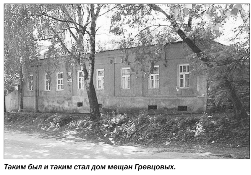
Таким был и таким стал дом мясн Гревцовых.