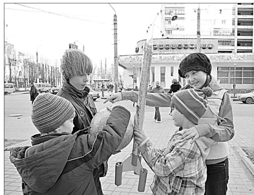
Мальчишки мечтают о космосе.

- Когда мы приехали в это здание, оно было в плачевном состоянии: одни стгившие гобелены чего стоят,