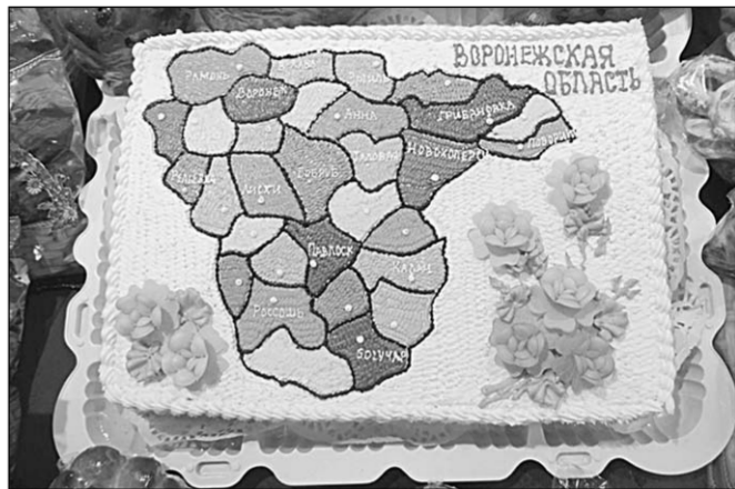
Этот оригинальный воронежский торт неизменно привлекал внимание участников выставки.

Воронежцы со всей ответственностью готовились к этому ежегодному международному смотрю современного хлебопечения и приложили максимум усилий для достижения высоких результатов. Подвела итоги первого тура, дегустационная комиссия допустила к финальному этапу всероссийского конкурса «Лучший хлеб России» 20 хлебопекарных предприятий из 32, в том числе воронежские ОАО: «Тобус», «Хлебозавод №2» и «Хлебозавод №7». В ходе «народной