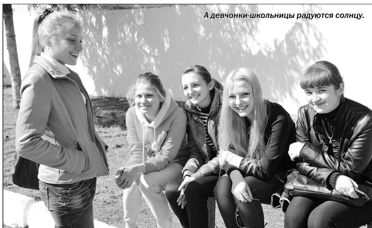
А девчонки-школьницы радуются солнцу.

... Скажите, а чем слаვენ Воронеж? На память приходят крылатые выражения: «Воронеж – колыбель российского флота», «Воронеж – город воинской славы». И как бы это увязать с Первомаем? Впрочем, астраханская вобла скорее сочтается с пивом, чем с Днём международной солидарности трудящихся.