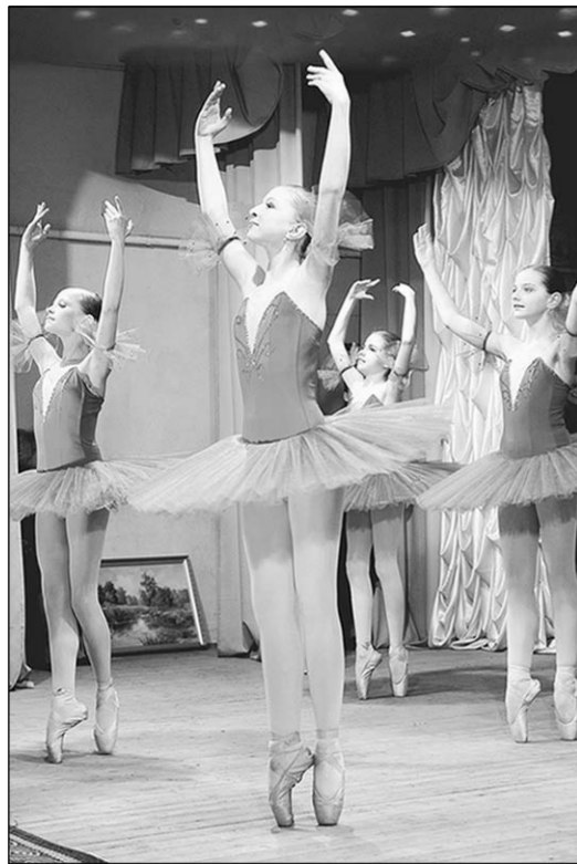
Балетные миниатюры «Эскизы».