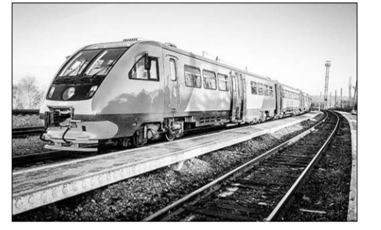
жени неподалёку от улицы Южно-Морская), в 7.18 на станции Воронеж-Курский.

Предусмотрено три остановки: в 7.01 на о.п. 236 км, в 7.07 на о.п. 239 км (обе остановочные площадки располо-