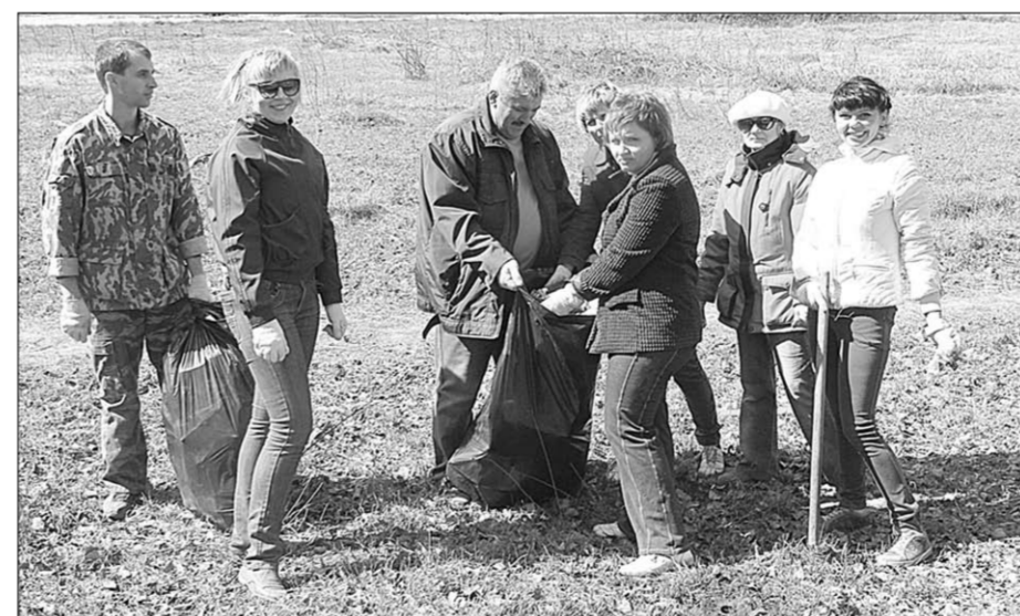
Семилуковцы хотят сделать свой город чище.

По предварительным подсчётам, в мероприятиях по наведению чистоты и благоустройству Семилуков приняли участие около полторы тысячи горожан. С их помощью с городских территорий было собрано и вывезено около 400 тонн мусора. Покрашено и приведено в порядок семь километров бордюрного камня. Побелено около 300 деревьев.