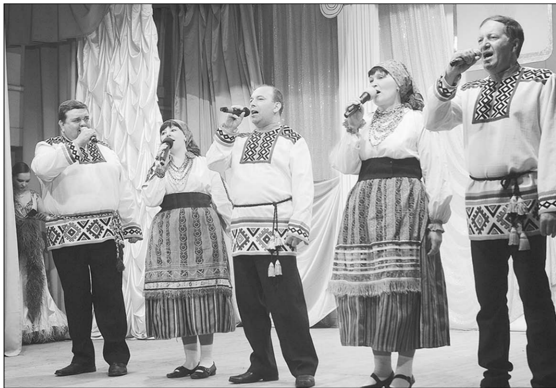
Народный ансамбль «Радуга».