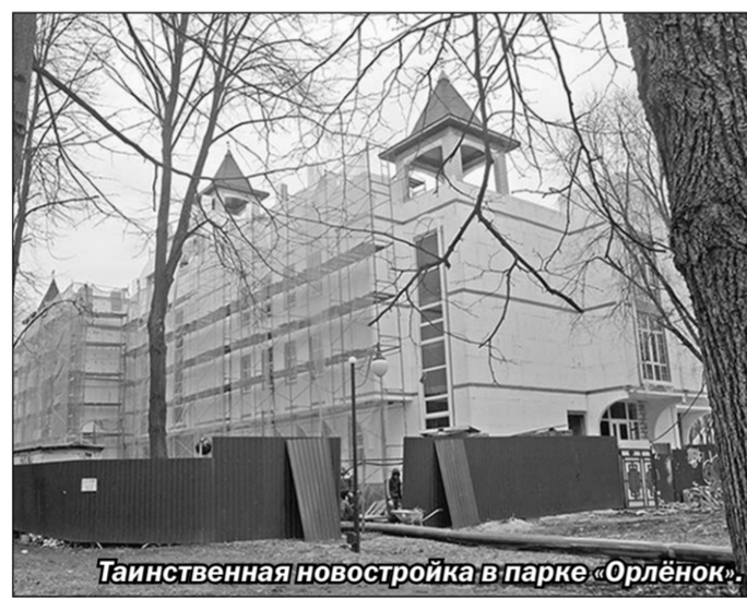
Таинственная новостройка в парке «Орлёнок».

Поскольку при выступлении свои имена и должности они произносили невнятной скороговоркой, то многие участники слушаний так и не поняли, какие властные структуры они представляют. Оказалось, что чиновники пришли на слушания без каких-либо идей и без предварительного плана сохранения остатков уже порядком изуродованного парка. Выяснилось, что слушания были собраны с одной целью — узнать мнение горожан о дальнейшей судьбе этого клочка зелени в центре города. Впрочем, одна из идей у чиновников была: срочно найти инвестора и отдать ему «Орлёнок» в аренду, поскольку,