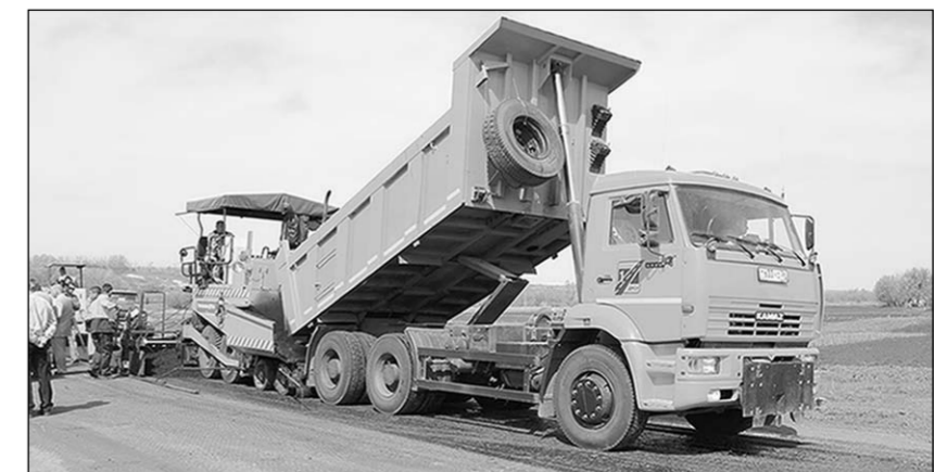
Укладка асфальтобетона на участке дороги «Воронеж-Луганск»-Подгоренский.