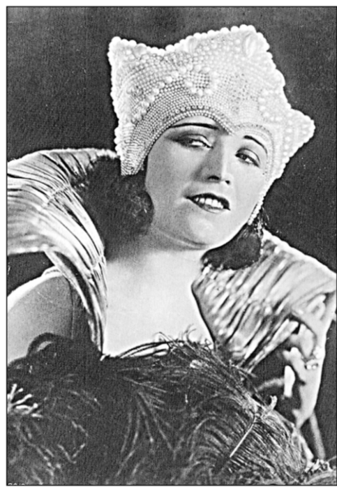
Та самая открытка с фронта с портретом Мэри Пикфорд.

«Привет из Газни! Здравствуйте, Аллочка!