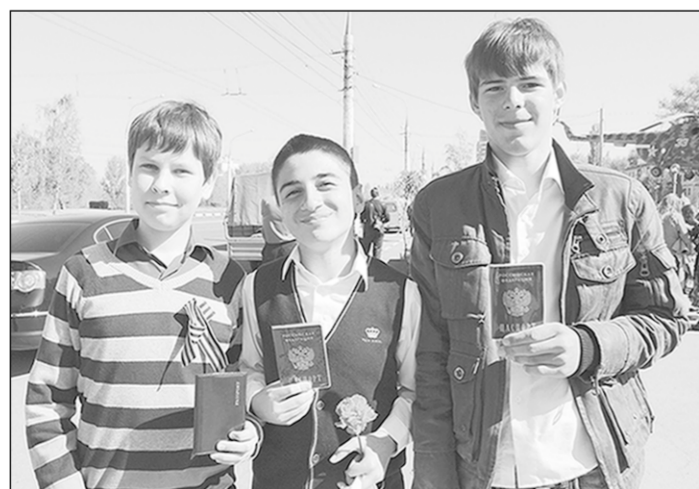
Герои дня с паспортами.

С места события | Вчера у «Музея-диорамы» состоялось торжественное вручение паспортов молодым воронежцам