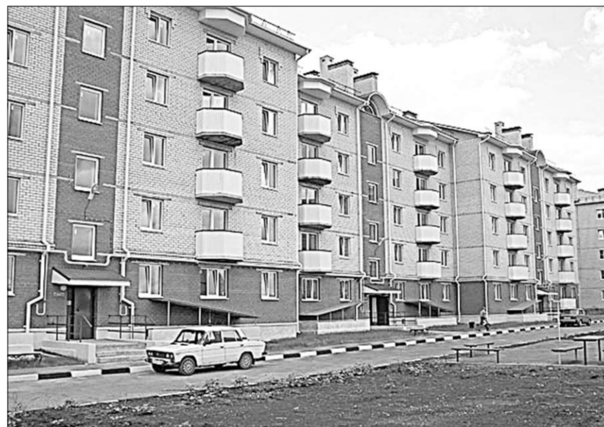
Дом, в котором хочется жить.