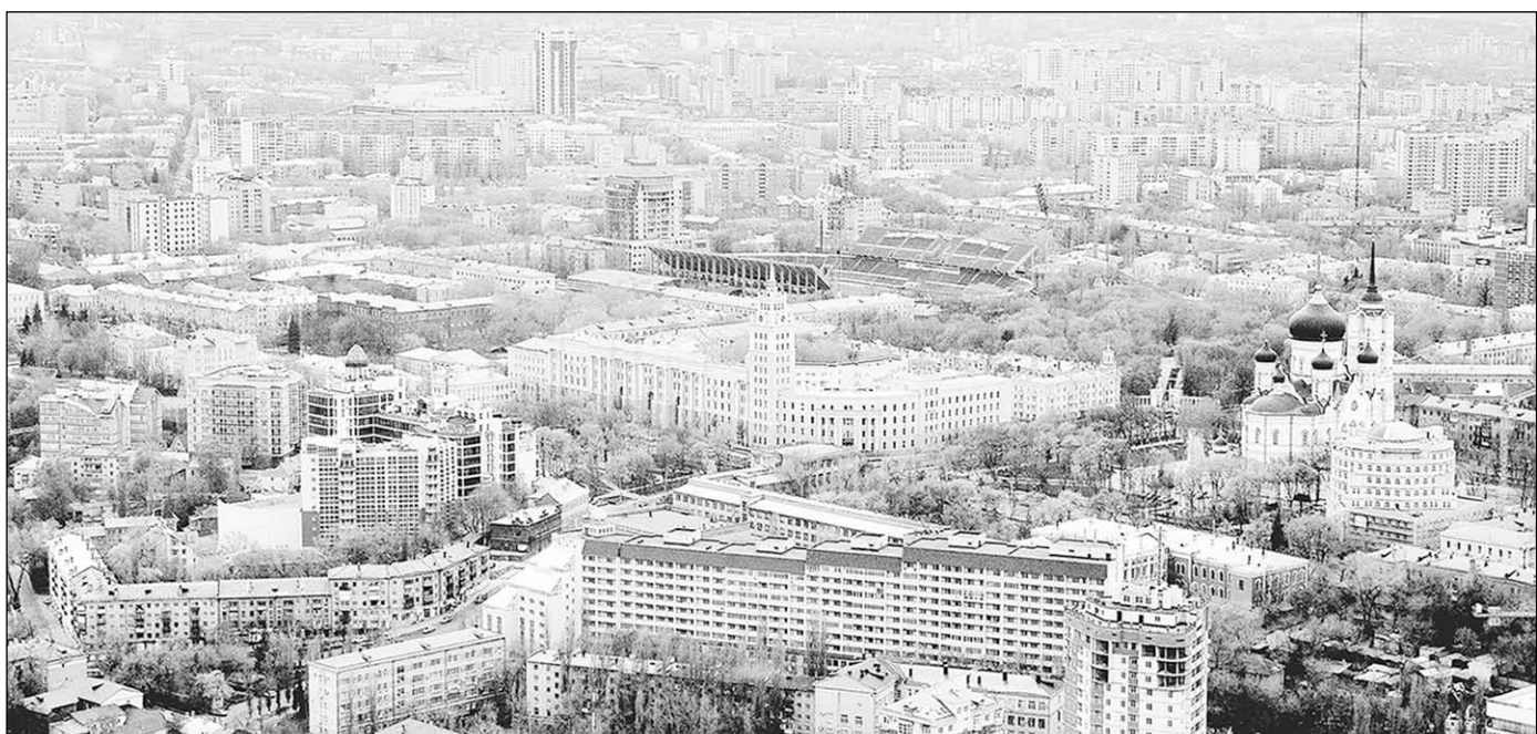
Мегаполис, в котором жить всё труднее.

Позиция губернатора – понятная. А вот строительное бизнес-сообщество и словом