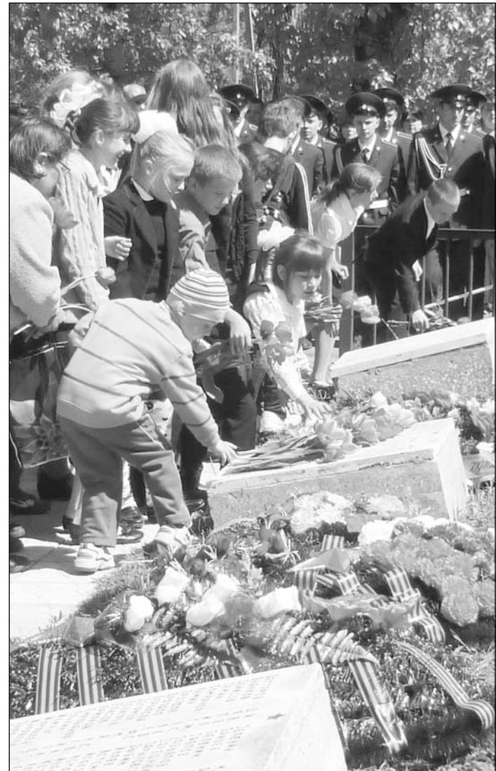
Цветы возлагают самые юные.

И очень здорово, что память о защитниках Отечества всё-таки сохраняется — быть может, благодаря и нам, и людям, пригласившим нас сюда.