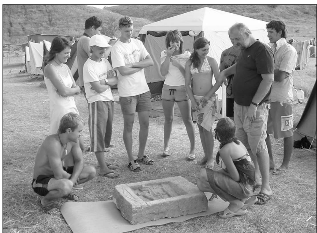
Студенты на практике.