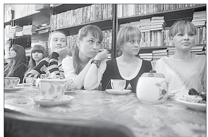
Они только делают пробы пера.