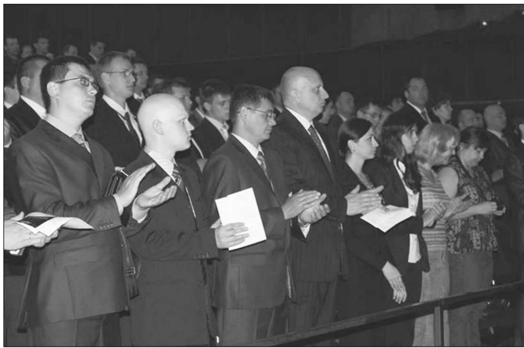
Молодая партия спланирует ряды.

В партиях и движениях | В Воронеже состоялось первое общее расширенное собрание регионального отделения «Народной партии России»