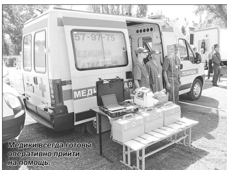
Медики всегда готовы оперативно прийти на помощь.

После торжественной церемонии возложения венков к стеле «Воронеж - город воинской славы» на территории Центра военно-патриотического воспитания «Музей-диорама», полномочный представитель Президента РФ посетил железнодорожный вокзал Воронеж-1. Вместе с губернаторами и главными федеральными инспекторами регионов, входящих в состав ЦФО, полпред ознакомился с организацией си-