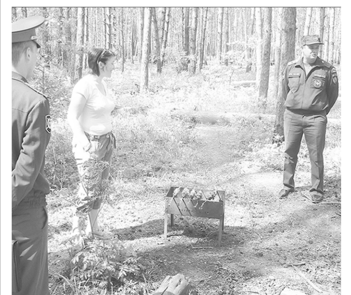
Нарушителей – к ответу!

И всё же Главное управление МЧС России по Воронежской области напоминает, что нарушениями «Особого противопожарного режима» грозит штраф от двух до четырёх тысяч рублей. Для должностных лиц – до 30 000, для юридических – до 500 000 рублей.