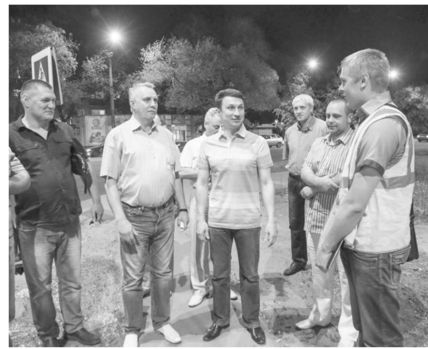
«До идеала далеко», - таково мнение и.о. мэра о дорогах Воронежа. Работа - полным ходом.

«Мы сравниваем дороги с соседями: Липецком, Саратовом, Волгоградом. В прошлом году это сравнение было не в нашу пользу, а вот в нынешнем в Воронеже дорожная ситуация лучше, чем у них. Это приятно», - отметил лидер общественного движения.