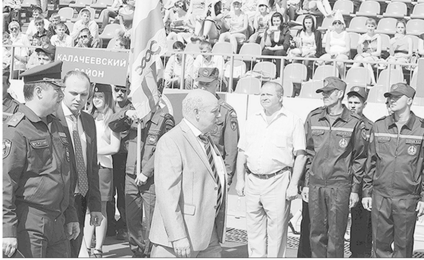
Благодарность – добровольцам.

Состязания | На центральном стадионе профсоюзов «Труд» участники добровольных пожарных команд из Воронежской области продемонстрировали свои навыки в борьбе с огнём