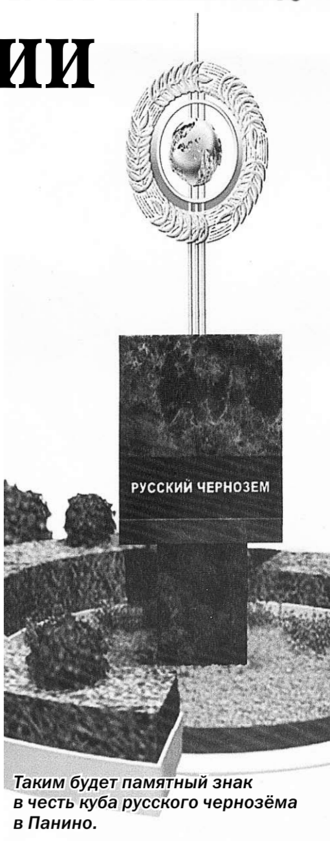
Таким будет памятный знак в честь куба русского чернозёма в Панино.