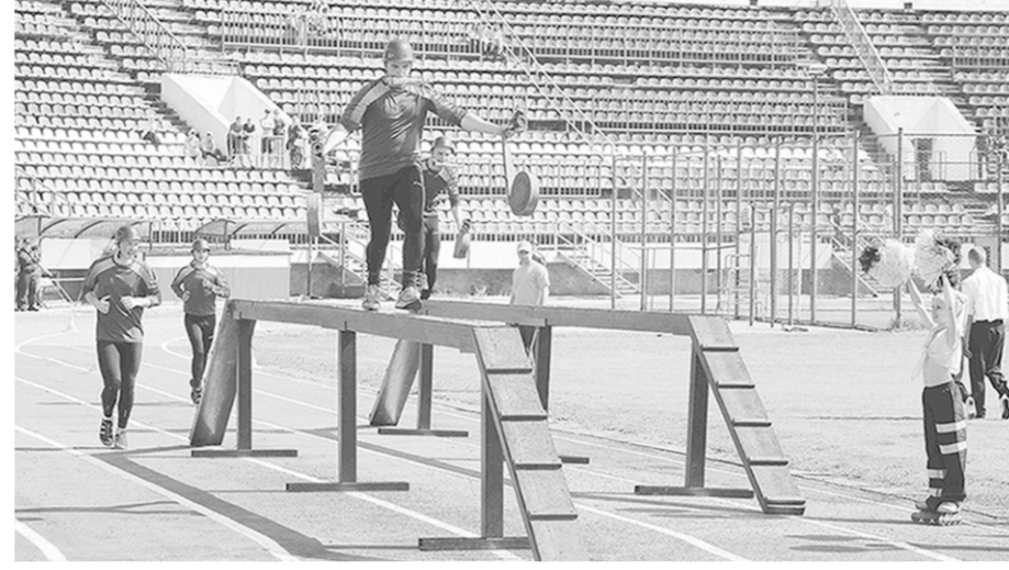
Конкурсанты – на старт!