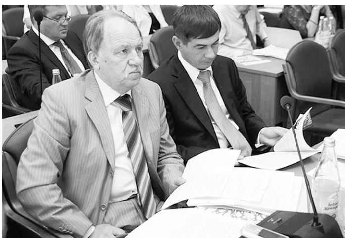
Депутаты заинтересовались стоимостью проекта реконструкции стадиона «Чайка».

В результате утверждённой корректировки доходная часть бюджета городского округа город Воронеж составила 12,6 миллиарда рублей, расходная – 13,5 миллиарда рублей, дефи-