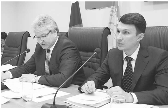
Один из вопросов – очередная корректировка бюджета города.

Павильоны несут на себе социальную функцию, располагаясь в тех местах, где