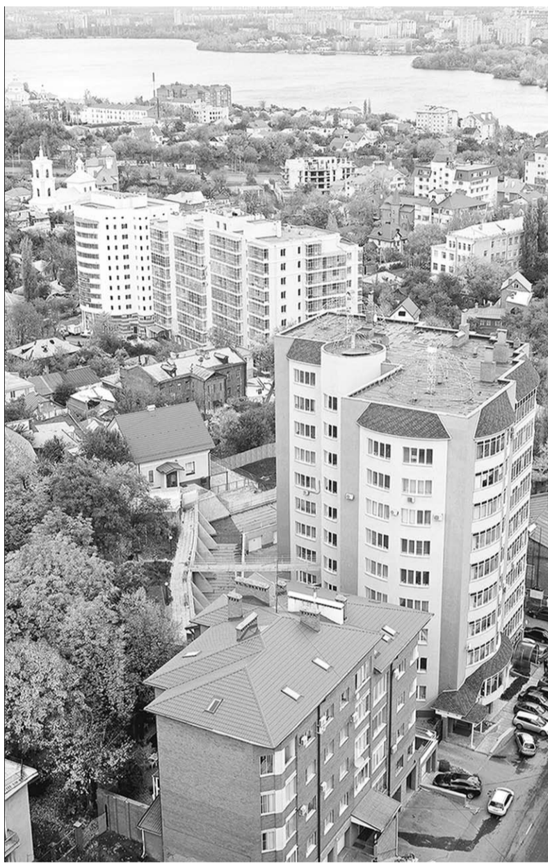
Растёт не только недвижимость, но и налог на неё.

К примеру, средняя цена одного метра многоэтажного жилья в Москве составляет 163,4 тысячи рублей (это максимум по крупным российским городам), а в Новокузнецке – лишь 37 тысяч рублей (минимум). В соседнем с нами Белгороде, который имеет более высокий уровень жизни, этот показатель равен 58 тысячам; в Воронеже ходовая цена – 48 тысяч, что на 10 тысяч рублей больше, чем в среднем по РФ.