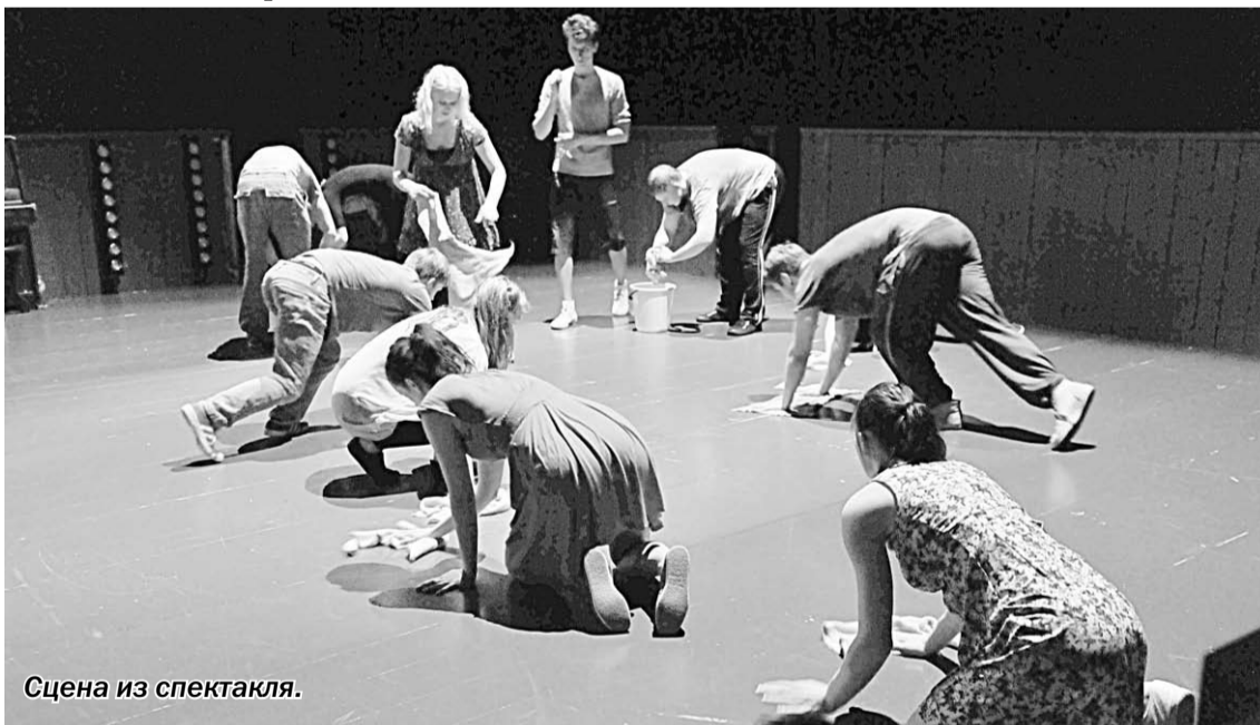
Сцена из спектакля.

По форме спектакль представляет собой некий синтез актёрских студенческих лабораторных работ «над собой» и, по-видимому, типичного спектакля этого театра, который не пользуется традиционной драматургией, а соз-