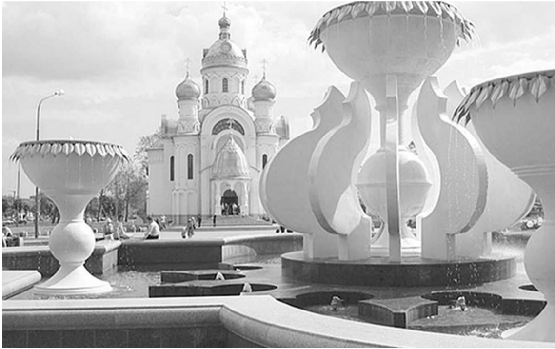
Одно из любимых мест отдыха горожан.

Наличие форели на столе меня сразило наповал.