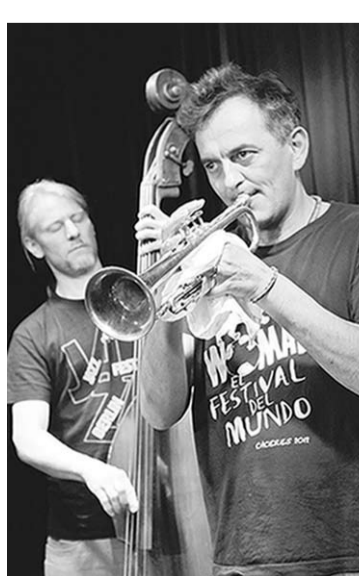
Мастер-класс в «Петровском».

Программа была составлена из произведений разных эпох – чтобы широкая публика услышала всю палитру звучания квартета саксофонов. Диапазон музыки, исполняемой Sonic.art, – от Ио-