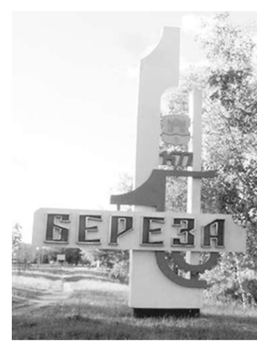
– Здравствуй, Берёза!

Белоруссия и Россия образовали Союзное государство, – объявил Николай. – Я думаю, что наши страны только выиграют от того, что недавно объявлен конкурс «Лучшие товары Белоруссии на российском рынке». Как базисом на земле? К тому же хозяйства испытывают сложности по причине правительственного курса на импортозамещение. К примеру, семена кукурузы лучше зарубежные, а используются местные сорта.