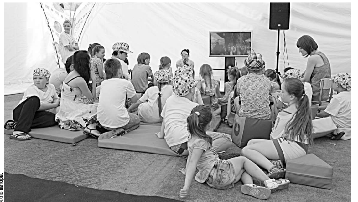
Воронежских детей ждали под специальным шатром.

С 8 по 10 июня на Советской площади, можно сказать, царили стенды различных книжных издательств страны: от классических университетских до «модерновых» - вроде издательства студии Артемия Лебедева