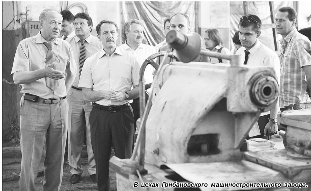
В цехах Грибановского машиностроительного завода.