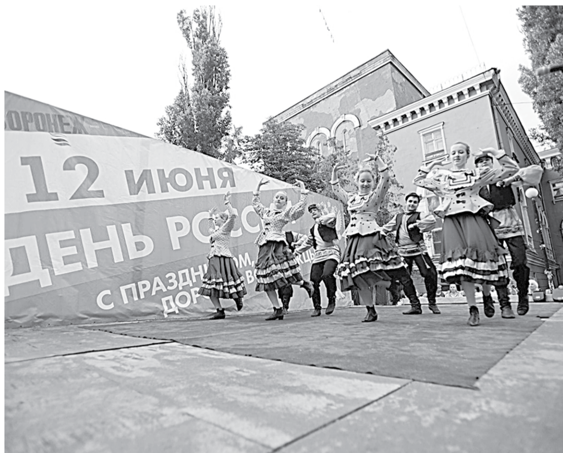
Народные пляски – примета праздника.