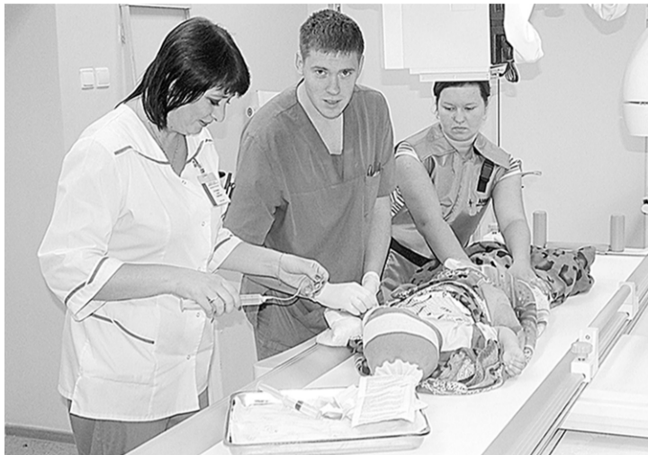
Скорая помощь – для маленьких пациентов.

В прошлом году эта больница отметила свое 75-летие. За это время она завоевала авторитет у коллег, став одним из крупнейших детских лечебных учреждений страны. Ежегодно через все отделения больницы проходит более 22 тысяч больных детей, через пункт экстренной травматологической помощи – более 17 тысяч человек, в поликлинике получают высококвалифицированную консультативную помощь более 15 тысяч детей из