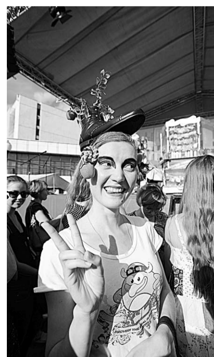
Такого у себя на голове я не ожидала.

начала работать с первыми клиентами, узнала потребности людей, их желание измениться, я решила быть более креативной, - рассказала она.