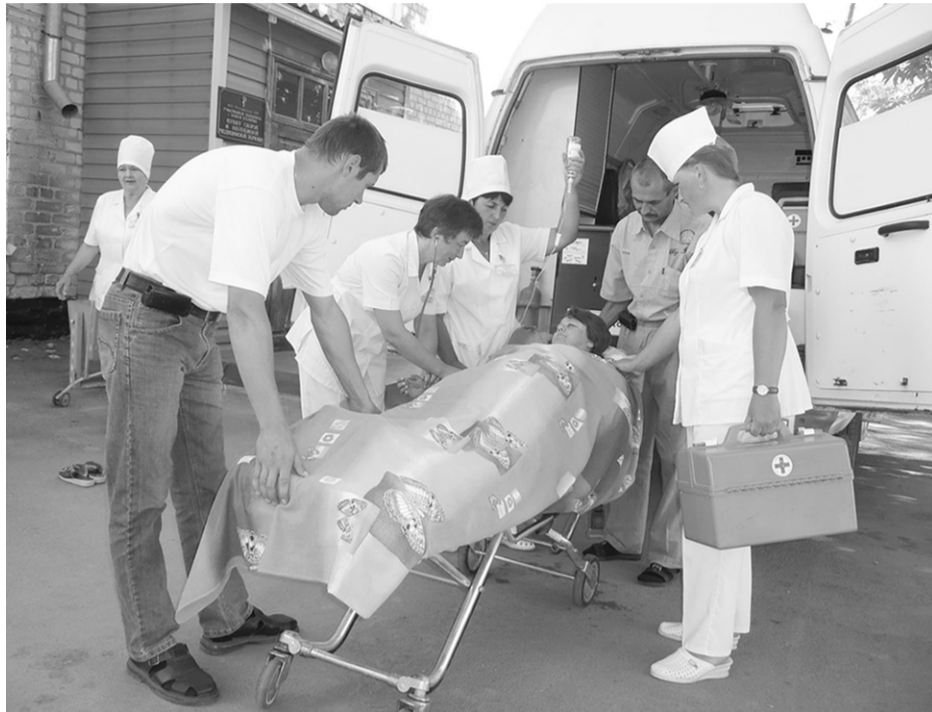
«Скорая медицинская помощь» участковой больницы села Новая Калитва.