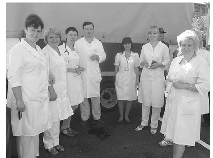
Медики готовы к работе в сложных условиях.

- На примере нашей поликлиники замечу: при одноканальном финансировании мы завершили работу в первом квартале 2013 года без долгов. В среднем у всего медицинского персонала на 15 процентов повысилась заработная плата. К концу 2013 года департамент здравоохранения области планирует довести её повышение до 26-30 процентов. Уверена, что с задачей, поставленной департаментом, поликлиника №8 справится. За то, что это