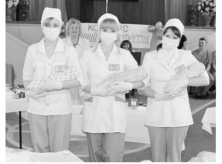
На конкурсе медсестёр.