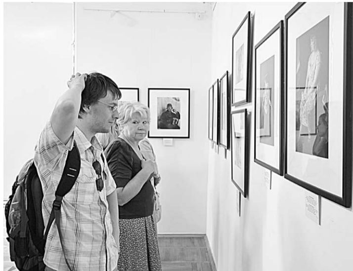
На открытии выставки «Круг Родченко».

Мечтавшие построить новый мир конструктивисты так же, как живший по соседству советский обыватель, пили чай,