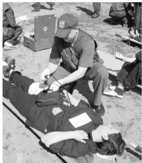
Их миссия – спасать пострадавших.

Здесь обращаются в среднем 2500 больных и пострадавших в год. Не меньше половины случаев требует выезда или вылета специалистов Центра на место к больным для оказания специализированной медицинской помощи. В состоянии «готовности номер один» круглосуточно пребывают три врачебных бригады. В этих бригадах дежурят свыше 30 специалистов-медиков, 10 реанимобилей, оснащенных самым современным оборудованием, проверенный временем самолет Ан-2, готовый вылететь в любую минуту. А с сентября прошлого года в помощь врачам прибыл санитарный самолет швейцарского производства Pilatus PC-12, внутреннее техническое оборудование которого включает в себя аппарат для искусственной вентиляции легких, кардиомонитор с дефибриллятором и другое современное реанимационное оборудование. К слову, Воронежская область – единственный регион из всего Центрально-Черноземного федерального округа, где экстренная санитарная авиация непрерывно существовала с 30-х годов прошлого века.