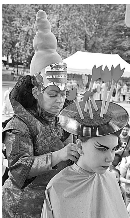
Чем затейливей шляпка, тем лучше.

- На протяжении нескольких лет работа парикмахером была для меня хобби. Но когда я вдохновилась профессионализмом людей этой специальности,