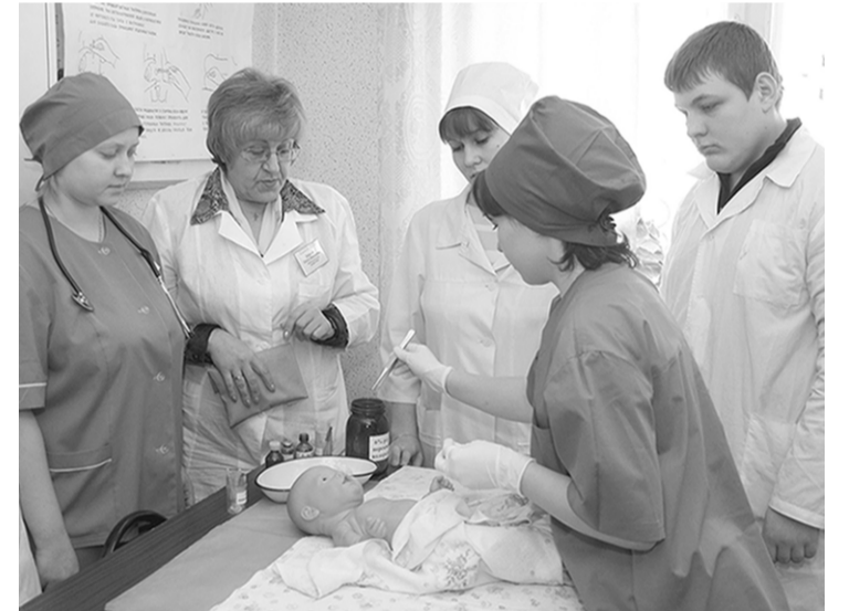
В учебном классе – будущие медсестры.

медколледж. Здесь до сих пор нет интерактивных досок, мультимедийного оборудования, современных муляжей, фантомов. А как научить лечить людей на пальцах?