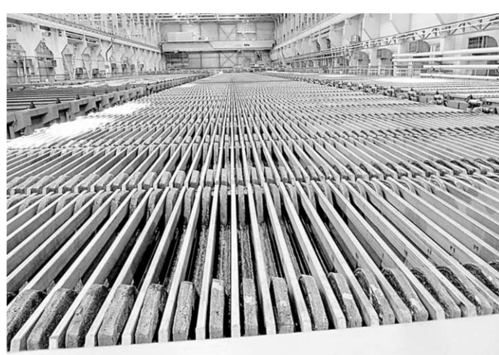
Новый цех электролиза меди ОАО «Уралэлектромедь».

— Это — пары серной кислоты, в небольшом количестве они даже полезны для органов дыхания, — объяснил Хазиев. — Технология производства не требует постоянного присутствия людей в цехе. То время, что они здесь проводят, никак не отражается на их здоровье. Всего на этом заводе трудится около четырёх тысяч человек,