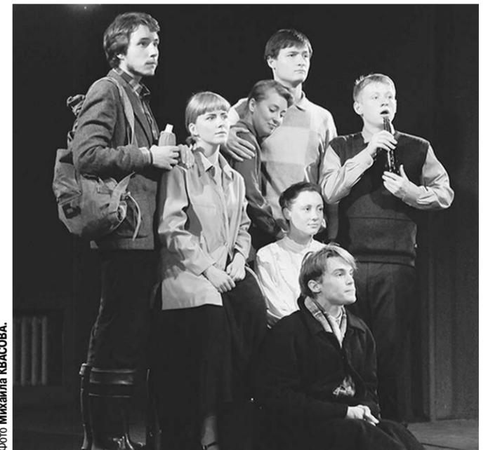
Сцена из спектакля «Невозможное».

То, что молодые так чувствуют и передают прозу Андрея Платонова, дорого стоит. Что, разумеется, не исключает и трагических спектаклей по его текстам.