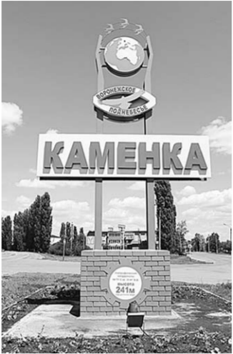
Именитый знак на въезде в Каменку.

На въезде в районный центр Каменка всех встречает именитый знак. Оказавшись, географически здесь — настоящее «поднебесье» нашей Воронежской области. Посёлок расположен на холме с отметкой в 241 метр над уровнем моря. Раз ближе к солнцу, то и цветы ярче, деревья зеленей. А вот вышел на клумбу как из сказки сине-голубой павлин. Цветы, парковые скульптуры — это дело рук мастеров и мастериц из акционерного общества «Евдаковский коммунальник». А стараниями жильцов дом №8 на улице, заметим, Солнечной стал лучшим в областном конкурсе «Лучший двор многоквартирного дома».