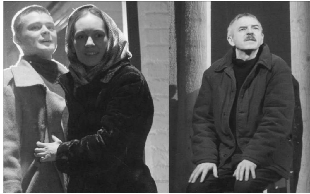
Сцена из спектакля «Река Потудань».

На сцене вдоль задника выстроились длинные доски: то ли забор, то ли ветхие стены, то ли заготовки для строительных лесов. В пространстве между ними и протекает жизнь героев спектакля. Кроме них еще два табурета – у Фирсовых и у Любы. Люба, которая в начале спектакля все время ходила только есть и спать, ложится прямо на пол, подложив под голову жакет. Пустое пространство перед этими досками, пересеченное полосатым деревянным половником, голая стена, расколота надвое широкой трещиной (потом она при определенном освещении превращается в изображение реки), редкие доски – все вызывает ощущение скудного бытия и бытия. Правда, какая-то особая чистота, свежесть досок и запахи свежежеструганного дерева ассоциируются и со строи-