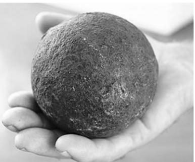
Пушечное ядро времён Фрола и Степана Разиных.