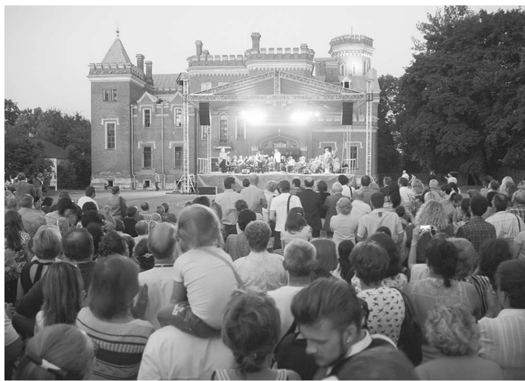
Концерт в парке замка принцессы Ольденбургской.