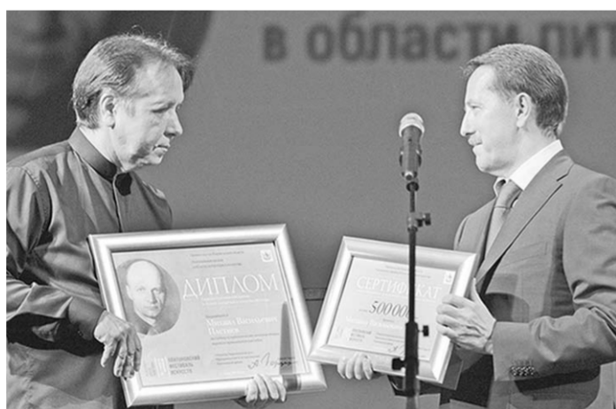
Алексей Гордеев вручил сертификат Михаилу Плетнёву.

Центральным и наиболее волнующим событием стало присуждение Платоновской премии. В этот раз лауреатом объявлен выдающийся дирижёр и пианист Михаил Плетнёв. На предыдущих фестивалях, напомним, звание лауреата получили писатель Борис Екимов и режиссер