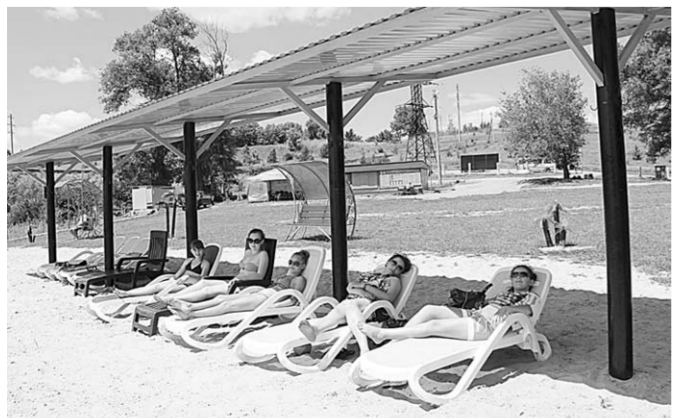
У пруда на пляже.