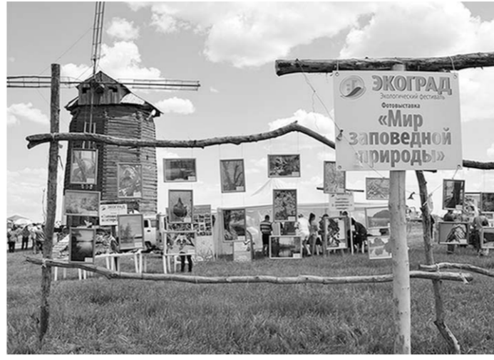
В рамках фестиваля прошло много выставок.