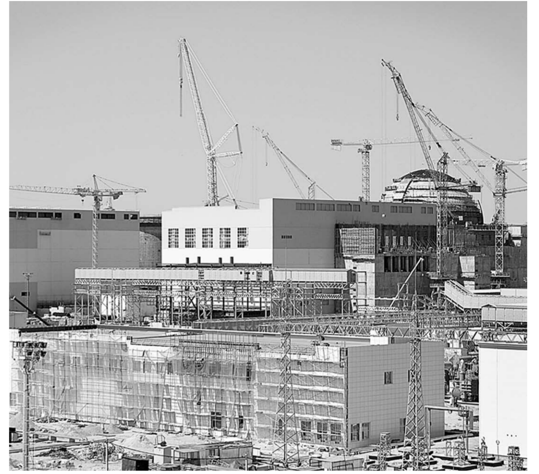
Нововоронежская АЭС-2 - главная стройка «Атомэнергпроект».

внешний облик вытяжная башня градирни второго энергоблока. Монтаж опорных железобетонных конструкций, которые стали основанием для обложки градирни, был завершён в феврале. Причём для этого потребовалось на 80 дней меньше, чем при возведении опорных конструкций первой градирни. Оптимизация проводится в рамках реализации проекта Производственной системы «Росатом», когда исключаются непроизводительные потери, сокращаются сроки выполнения работ при безусловном сохранении качества.