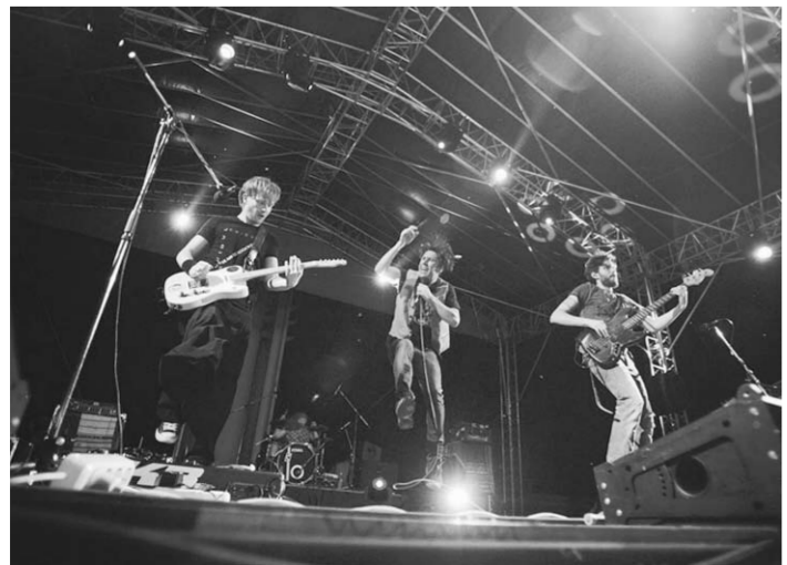
На сцене – Zdob si zdub.