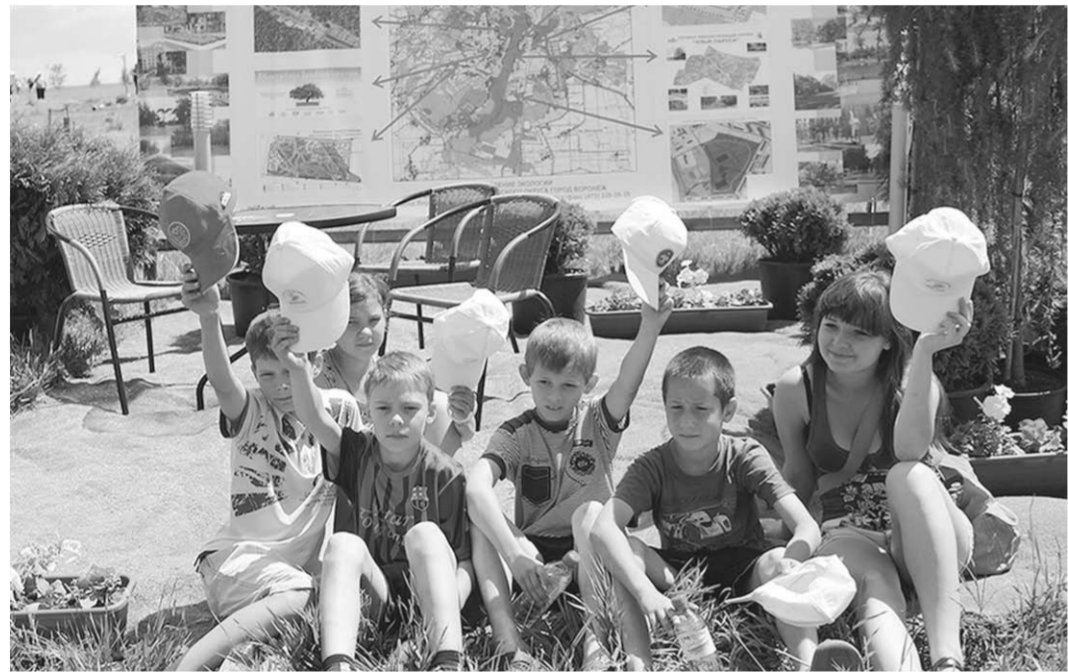
Главными героями праздника стали школьники со всей области.

Выставка «Заповедная мастерская» была приурочена к 90-летию Воронежского го-