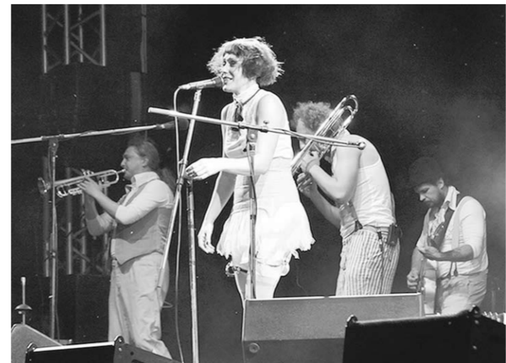
Играет и поёт белорусская «Серебряная свадьба».

сказать, фолк-рок коллектив из Молдовы соединяет людей из наших двух стран так же, как и активно смешивает в своем творчестве хардкорный напор и народные ритмы.