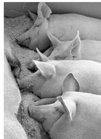
И только у них – безмятежное спокойствие.

Для возмещения ущерба, понесенного жителями, вы-