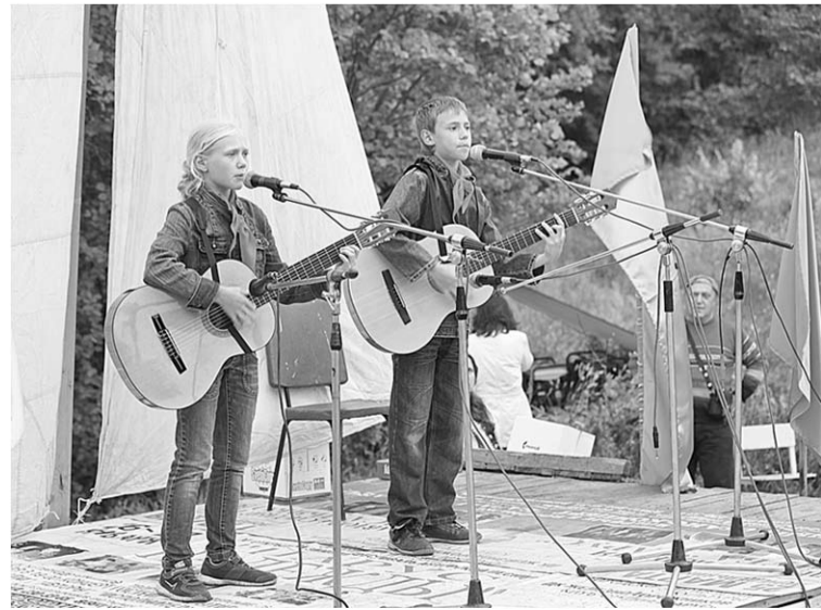
Детей на сцене встречали с особым радушием.