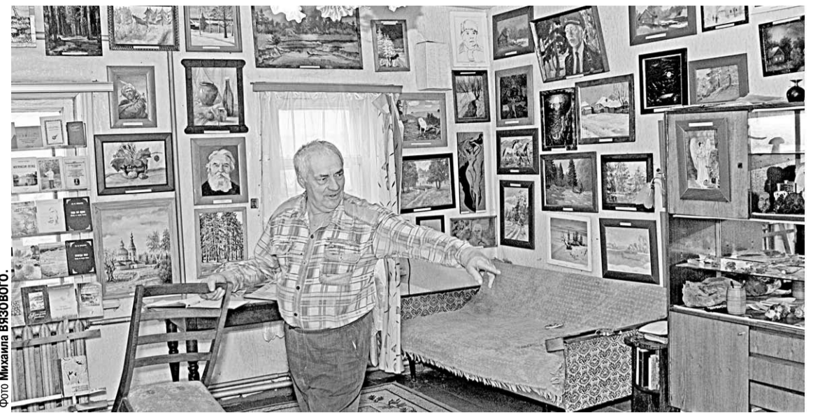
Греет душу собирателя вся его коллекция.

Знай наших! Как деревенский дом в Бобровском районе музеем стал