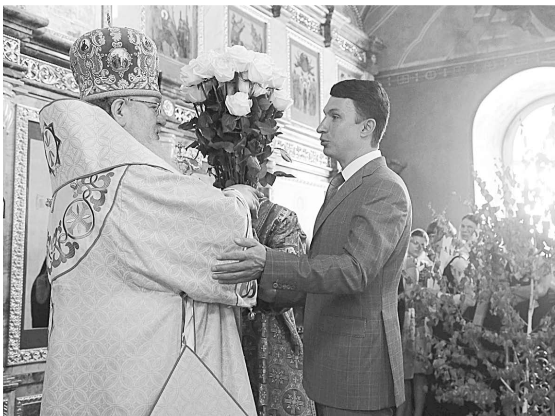
Геннадий Чернушкин поздравил митрополита Воронежского и Борисоглебского Сергия с праздником.