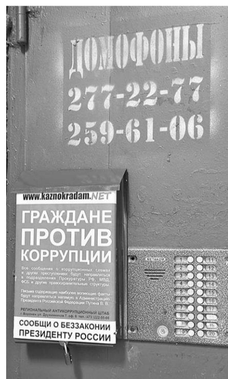
Такие ящики скоро увидят и воронежцы.

Вспомним, какой накал и яростные споры вызвал закон, запрещающий чиновникам и депутатам иметь счета и имущество за рубежом. Высокопоставленные