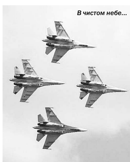
В чистом небе...