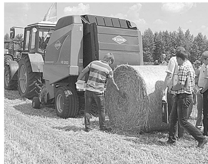
Неподдельный интерес аграриев вызвали и сеялки точного высева, и прицепные опрыскиватели, и пресс-подборщики, и другая техника KUHN.