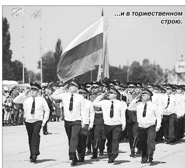
...и в торжественном строю.