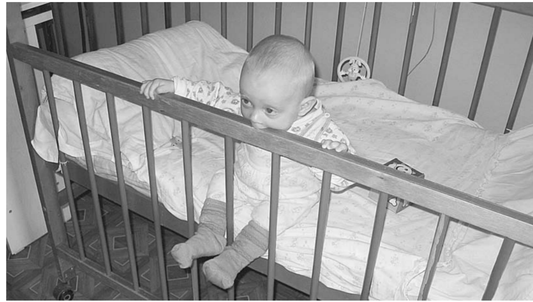
Брошенные дети тоже нуждаются в любви и ласке.