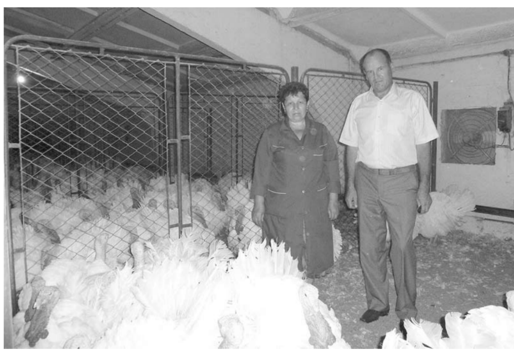
В ожидании реализации на птичнике скопились тысячи голов индейки.

Поскольку в этом году спрос на яйцо был мизерным, мы были вынуждены прекратить яйцескладку еще в мае, на месяц раньше обычного. Это стало для нас и моральным, и финансовым ударом, ведь мы потеряли запланированные