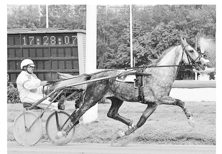
Бег Заветного вызывает восхищение.

На Центральном московском ипподроме состоялся розыгрыш приза Президента Российской Федерации. Рысаки орловской породы состязались на дистанции 1600 метров.