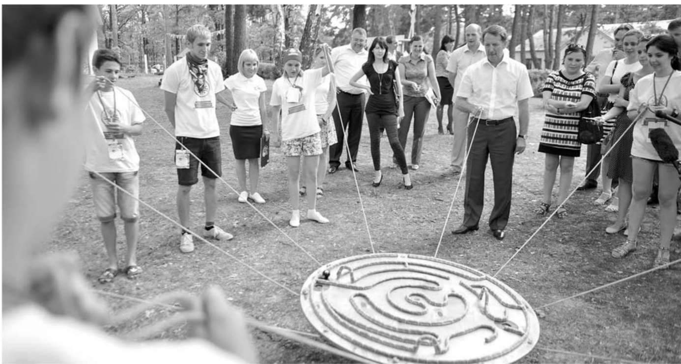
В игре всё, как в жизни – если не будешь одной командой, не победишь.